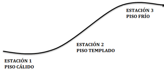
Gráfico 1. Ubicación espacial de las estaciones de estudio del Observatorio Agropecuario del Cambio Climático (OACC) en el departamento Norte de Santander