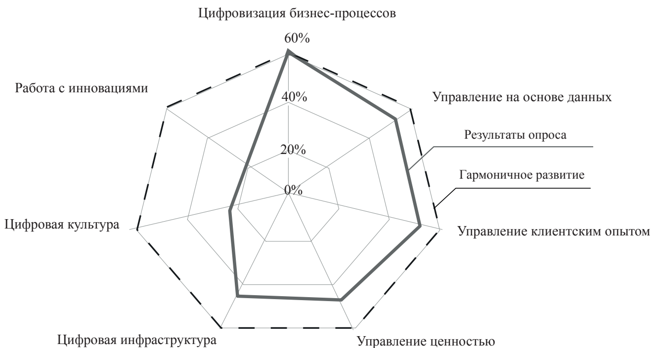
Рис. 2. Приоритеты направлений цифровой трансформации российских компаний

Составлено авторами по материалам источника [9]