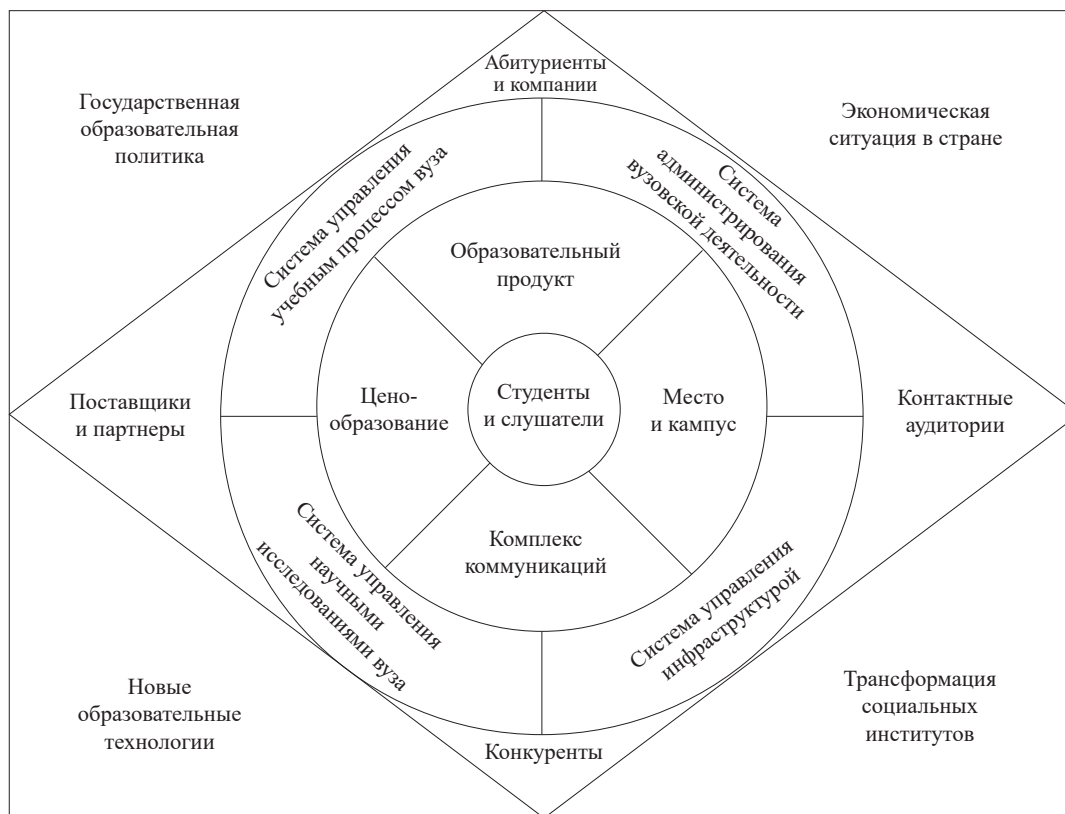
Составлено авторами по материалам источников [2; 4; 5]

4) комплекс внешних и внутренних маркетинговых коммуникаций вуза, или арсенал средств рекламного воздействия, PR, стимулирования продаж и другие. Растущую роль играют цифровые маркетинговые коммуникации, основанные на использовании персонализированных пакетов электронных услуг и специализированных интернет-приложений, обеспечивающих рост заинтересованности обучающихся и преподавателей в индивидуальной и групповой активности в виртуальной среде: университетской электронной почте, блогах, социальных сетях и других каналах.