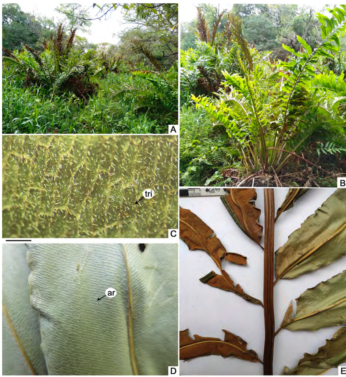
Fig. 2. Hábitat, aspecto general y caracteres diagnósticos de Acrostichum danaeifolium . A. Población hallada en el Parque Nacional Río Pilcomayo. B. Aspecto general. C. Superficie laminar abaxial tapizada por tricomas blancuecinos (tri). D. Areolas de la venación adyacentes a la costa (ar). E. Porción de lámina en cara abaxial. Escalas: C= 1 mm; D= 10 mm; E= 20 mm.

depositados en los principales herbarios de Argentina se confirmó la existencia de escasas colecciones de la especie para Misiones y Chaco. En el primer caso, únicamente se registraron especímenes colectados a principios del siglo XX por E. Kermes (SI22937, CTES193320) y T. J. V. Stuckert 10096 (CORD),