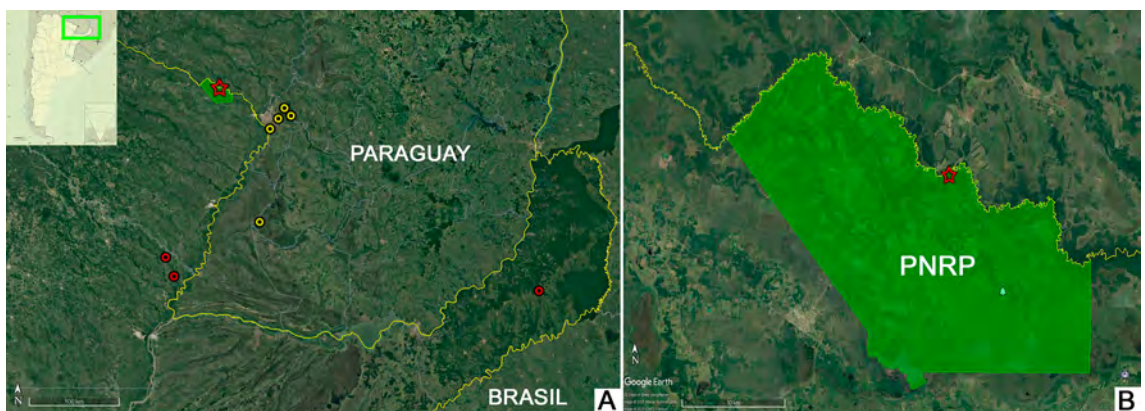
Fig. 1. Distribución de Acrostichum danaeifolium en Argentina. A. Círculos rojos = poblaciones en Argentina (la ubicación de la población perteneciente a Misiones fue ubicada en el centro de la provincia debido a que los datos de etiqueta son inexactos); círculos amarillos = Poblaciones en Paraguay; estrella = primer registro para Formosa (Parque Nacional Río Pilcomayo, Argentina). B. Detalle del Parque Nacional Río Pilcomayo mostrando la ubicación de la nueva población hallada.

Los especímenes fueron colectados, conservados mediante la técnica habitual de herborización, y depositados en los herbarios nacionales BA, LP y CTES. El análisis y la obtención de fotografías de las características morfológicas diagnósticas fue realizada bajo lupa estereoscópica.