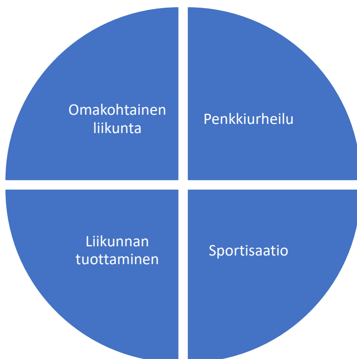
Kuvio 2. Koski 2004. Liikuntasuhteen neljä osa-alueetta.

Ensimmäinen osa-alue eli omakohtainen liikunta viittaa yksilön henkilökohtaiseen liikunta-aktiivisuuteen. Liikunnallinen elämäntapa kuvastaa positiivista liikuntasuhdetta. Liikunta-aktiivisuus rakentuu toiminnan intensiteetin, toiminnan tavoitteellisuuden ja eri toimintamuotojen suunnassa. Se sisältää vapaa-ajan liikuntaharrastukset sekä lisäksi arkiliikunnan. (Koski 2004, 192.)