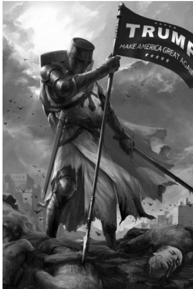
Afbeelding 14. Kruisvaarder in een Romantische pose. De vlag voert de campagneslogan 'Trump, Make America Great Again.' Vermoedelijk stelt het afgehakte hoofd rechtsonder Ted Cruz voor, één van Trumps tegenstanders in de strijd om het presidentschap in 2016. 55

Een andere recente gebeurtenis waarbij veel kruisvaardermemes werden gedeeld, was de verkiezingscampagne van de Republikeinse presidentskandidaat Donald Trump in 2015-2016. De voorbeelden hieronder betreffen memes van Trumpaanhangers als kruisvaarders met een Trumpvlag en het afgehakte hoofd van een Republikeinse rivaal (afb. 14).