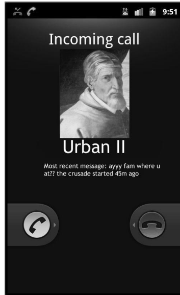
Afbeelding 9: Achtergrond van een smartphone die gebeld wordt door paus Urbanus II naar aanleiding van een eerder verzoek om deel te mogen nemen aan de kruistocht. Hierbij worden een persoon en een gebeurtenis uit de middeleeuwen naar de eigen tijd toegehaald. De middeleeuwen zijn niet het doel van spot. 34

Bij humoristische internetmemes is de grens tussen grap en belediging, of tussen neutraal en politiek geladen, vaag. Een manier waarop politieke opvattingen in humor verpakt worden, is superioriteitshumor. Daarbij probeert een enkele persoon of een bepaalde groep zichzelf boven een andere persoon of groep te plaatsen door om de ander te lachen (afb. 10). 35 Een variant is om een algemeen bekend historisch fenomeen, bijvoorbeeld de kruistochten, en die dan weer gereduceerd tot de slogan ‘Deus vult’, op een grappige manier in te zetten tegen bepaalde sociale geledingen. Een voorbeeld van een Facebook-account dat volledig gewijd is aan superioriteitshumor ten opzichte van de rechts-extremistische groepen zoals