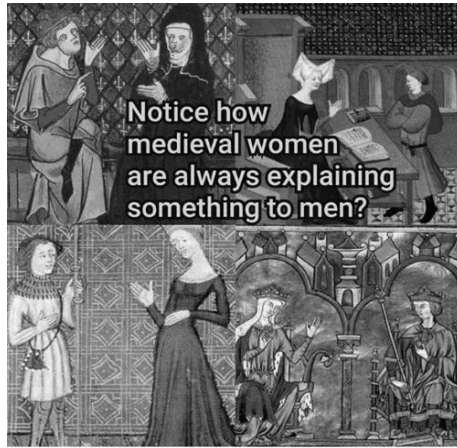
Afbeelding 7: Vier afbeeldingen waarop middeleeuwse vrouwen in een uitleggende houding gebaren naar een middeleeuwse man. Het doel van spot is enerzijds de vrouwenonderdrukking in de eigen tijd en anderzijds de overdreven eigentijdse opvattingen over de ondergeschiktheid van vrouwen in de middeleeuwen. 29

Veel van het komische mediëvisme in deze internetmemes heeft geen ander doel dan grappig zijn. Maar soms is dit soort memes dubbelzinniger: de humor kan een ernstige ondertoon hebben of gebruikt worden om bepaalde maatschappelijke waarden of vooroordelen te bevestigen. 30 Zo maken twee van de hierboven gegeven voorbeelden gebruik van satire om de spot te drijven met hetzij hedendaagse ideeën hetzij middeleeuwse opvattingen over de positie van vrouwen (afb. 6 en 7). In dat opzicht, zo stelt D’Arcens, kan modern satire als ‘forward-looking in its aspirations’ gemakkelijk worden gecombineerd met (neo)mediëvismen als ‘backward-looking in [their] inspirations.’ 31 Een belangrijke vraag is alleen op wie de spot dan feitelijk gericht is. Op de hedendaagse internetgebruiker of op (mensen in) de middeleeuwen? D’Arcens denkt op beide, dat hier sprake is van ‘satiric