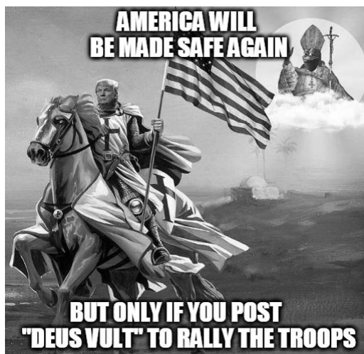
Afbeelding 15: Trump romantisch afgebeeld als tempelier rijdend op een paard door een oriëntalistisch landschap, gadeslagen door het bekende meme character Pepe de kikker als paus. De tekst suggereert dat Amerika weer veilig zal worden, als deze meme maar gedeeld wordt met de tekst 'Deus Vult'. Gepost op Reddit 19-09-2016. 56

Het is dus geen toeval dat dit soort memes tijdens de campagne doelbewust zijn ingezet om Trumps politieke boodschap te ondersteunen en daarmee de verkiezingen te beïnvloeden. Ook nadat Trump was gekozen, bleef hetzelfde type memes haast ritueel terugkeren, telkens als de president iets belangrijks deed. De krantenkop met foto bij een nieuwsbericht over de inauguratie-speech van Trump waarin hij beloofde radicaal-islamitische terreur uit te roeien, werd aangepast door Trumps hoofd van een kruisvaardershelm te voorzien en de geuzenleus 'Deus Vult' toe te voegen (afb. 16). Dat laatste is ook gebeurd met een nieuwsbericht over een in brand gestoken moskee in Texas (afb. 17).