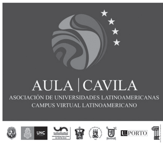
Figura 1. Marca AULA-CAVILA

Bajo este contexto y atendiendo a las reiteradas Declaraciones de las sucesivas Cumbres de Rectores Iberoamericanos, se plantea AULA (Asociación de Universidades Latino-americanas) para la integración de la enseñanza superior entre distintos países Iberoamericanos mediante el uso de las Nuevas Tecnologías y como una respuesta a la globalización y a los nuevos retos contemporáneos, que requieren nuevos cambios en las capacidades en procura de disminuir la brecha y los desequilibrios socioeconómicos.