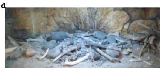
Figura 1. a) Pieza de divulgación oficial del Museo Municipal Ignacio Balvidares de Puan; b, c, d) Maquetas expositivas en la Sala Ser y Pertener del Museo de La Plata.

de guanaco, caballo prehistórico, un camélido extinguido, de ñandú y vegetales que recolectaban...". Estas piezas constituyen una minoría por sobre otras piezas en exhibición y se vinculan principalmente con la dieta de grupos cazadores recolectores.