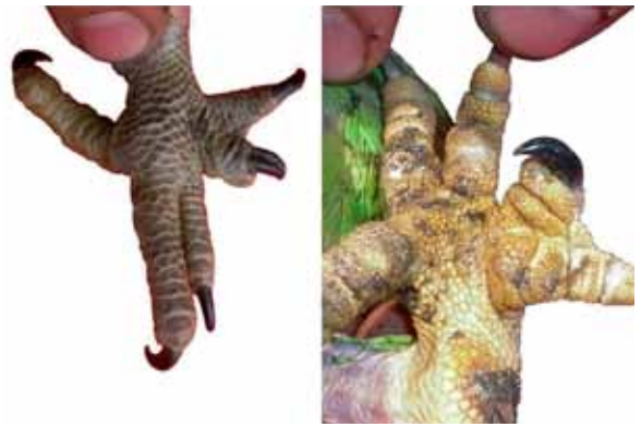
Figura 1. Vista dorsal y plantar del miembro pelviano derecho del pichón de “loro hablador” ( Amazona aestiva ) con polidactilia.

En cambio, las plumas del ala derecha mostraron una alteración en el patrón de coloración tanto para las barbas externas como internas. Las barbas externas mostraron rojo en la base de la pluma (en lugar de amarillo), luego amarillo (en lugar de verde), verde y por úl-