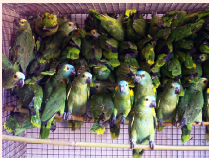
Figura 2. Ejemplares de loro hablador ( Amazona aestiva ) silvestres capturados para el comercio de mascotas.

El estudio de 2017, demostró que la peor amenaza para los loros silvestres es, actualmente, la captura para el comercio local e internacional de mascotas (Figura 2). Otras amenazas son el aumento de la población rural, la agricultura, la tala a gran escala y la destrucción de nidos por cazadores furtivos. Una diferencia con respecto a estudios anteriores, sugiere que en la actualidad, la agricultura y el pastoreo realizado por pequeños productores contribuyen a la disminución de las poblaciones. ¿Cómo se explica este hecho? Los loros están presentes con mayor frecuencia en las fronteras agrícolas, donde el cultivo y el ganado se producen a pequeñas escalas, en lugar de en sitios donde la agricultura a gran escala domina el paisaje. El estudio además demuestra que existen pocas