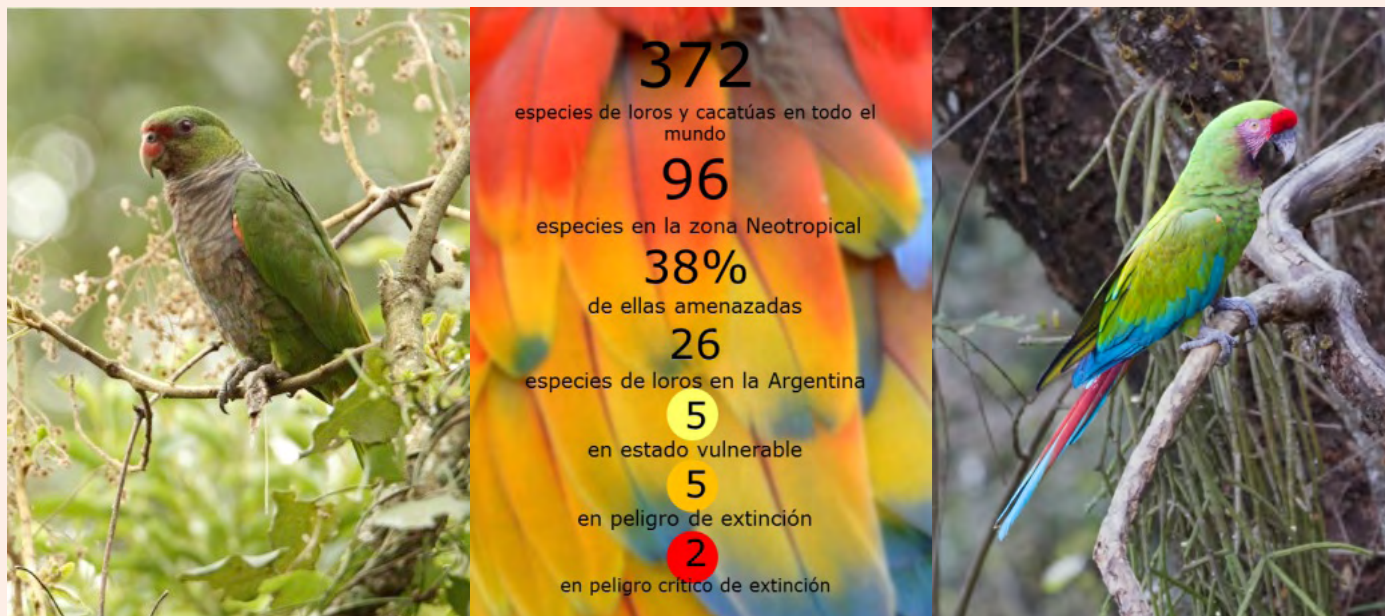
Figura 4. De izquierda a derecha: El loro vinoso ( Amazona vinacea ) y el guacamayo verde ( Ara militaria ) son dos de las especies de loros en peligro de extinción.

amenazas relacionadas con la persecución de los loros, como plaga de los cultivos, y la disminución de las poblaciones.