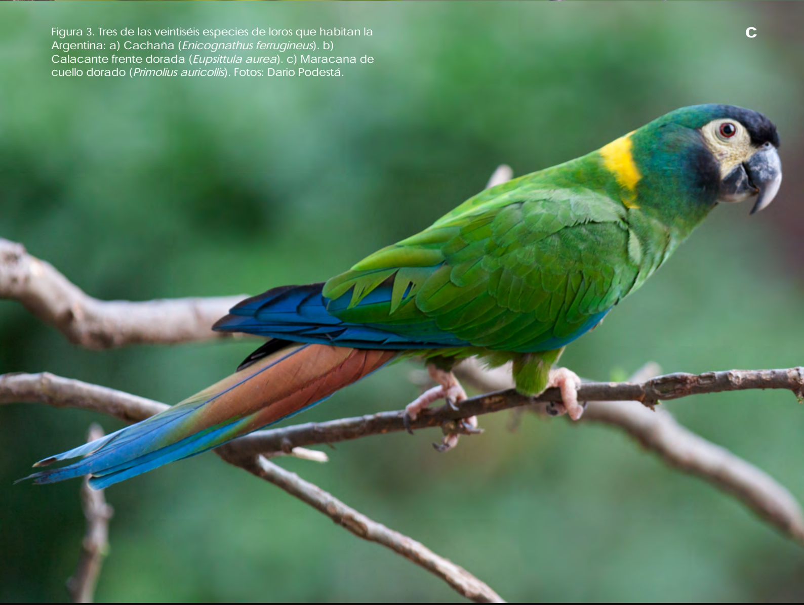
Figura 3. Tres de las veintiséis especies de loros que habitan la Argentina: a) Cachaña ( Enicognathus ferrugineus ). b) Calacante frente dorada ( Eupsittula aurea ). c) Maracana de cuello dorado ( Primolius auricollis ).