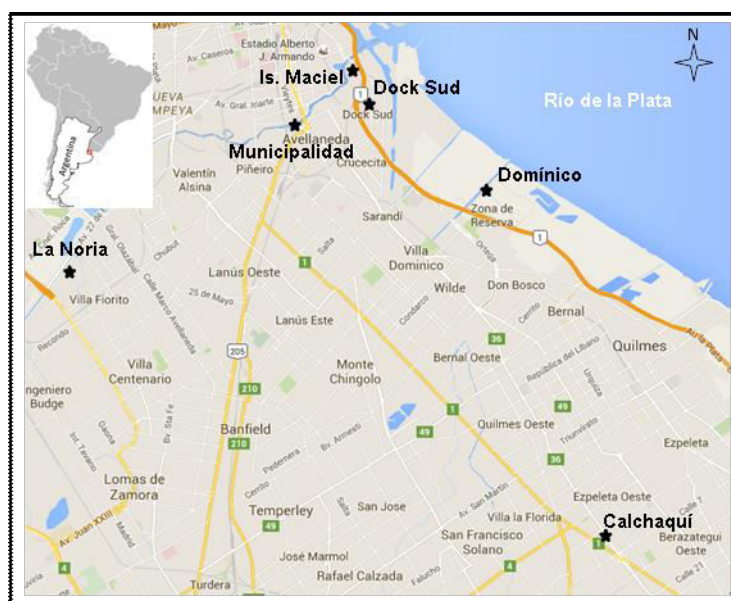
Figura 1. Área de estudio y ubicación de los sitios de muestreo.

Los sitios de muestreo (Figura 1) se seleccionaron considerando: alta intensidad de tránsito automotor (Calles: Municipalidad; Avenidas: Puente La Noria y Calchaquí), cercanía a fuentes industriales (Isla Maciel y Dock Sud), áreas de actividad hortícola periurbana y reserva (Quintas Domínico). Durante los meses de agosto a octubre, en cada sitio de muestreo se colocaron dos colectores de partículas (para análisis de metales y contaminantes orgánicos respectivamente) durante dos periodos mensuales. Asimismo en cada sitio se colectaron muestras integradas de suelo y sedimento vial.