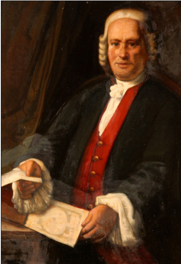
Figura 4. Retrato de Pedro Virgili.

Fue una de las piezas claves en el florecer de esta cirugía ilustrada y, a pesar de que sus restos mortales se desprestigiaron y se desconozca su paradero, su vida y sus obras serán inmortales (14) (Fig. 4).