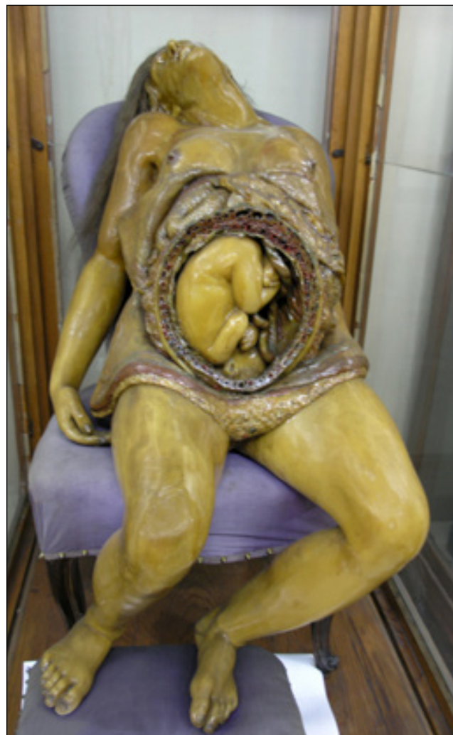
Figura 3. Modelo anatómico de la parturienta. Museo Anatómico “Javier Puerta”. Facultad de Medicina, Universidad Complutense de Madrid.

Los materiales que dispusieron para adentrar a los alumnos en la anatomía fueron a través de disecciones anatómicas sobre cadáveres y a través de modelos de ceroplástica. Entre estos, los más relevantes fueron los modelos fetales así como figuras que representaban el parto en su conjunto, como el modelo de “La parturienta” (Fig. 3). Los encargados de llevarlos a cabo fueron el profesor de escultura, Juan Chaez, y Luigi Franceschi (12). Es por ello que la enseñanza de la obstetricia tuvo un especial lugar también en este centro. Juan de Navas tuvo un papel destacable aun siendo su Cátedra la de “Materia Medica y Fórmulas” y no la de “Partos”. Su objetivo fue instruir a las comadres en el arte de partear a través de su libro “Elementos del arte de partear” publicado en 1795 (13). En la siguiente Tabla 1 se recogen diferentes aspectos de ambos Reales Colegios de Cirugía a modo de resumen.