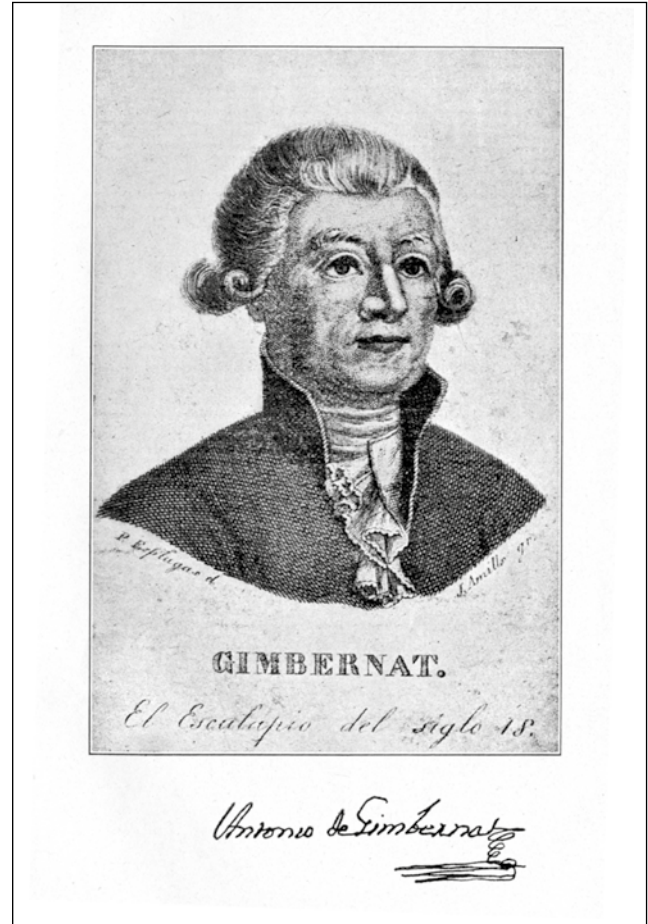
Figura 5. Representación de Antonio Gimbernat.

Madrid un nuevo colegio de cirugía. Este es creado en 1780 y brilla por la excelente docencia así como por sus modelos de ceroplástica que han sido considerados como de los mejores de su tiempo. Además,