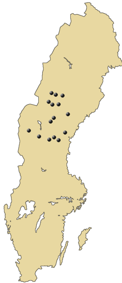
Figur 1. Sverigekarta som visar var de 15 beståndsparen är lokaliserade. Koordinater hämtade från Roberge & Stenbacka (2014)

Båda trädslagen planterades med barrotsplanter efter markberedning, i ett förband av 2,5 m. När myrinventeringen gjordes 2010 var bestånden 40 - 42 år och när stackinventeringen gjordes 2013 var bestånden 43 - 46 år. Bestånden har skötts som en vanlig produktionsskog enligt skogsindustrins normer inklusive röjning och gallring. Andra trädslag än contorta och tall som har självsått i bestånden har inte aktivt rensats bort.