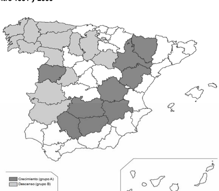
Figura 8. Evolución de la población rural entre 2000 y 2008 en las provincias con despoblación rural entre 1991 y 2000

Nota: consideramos municipios rurales los menores de 10.000 habitantes.