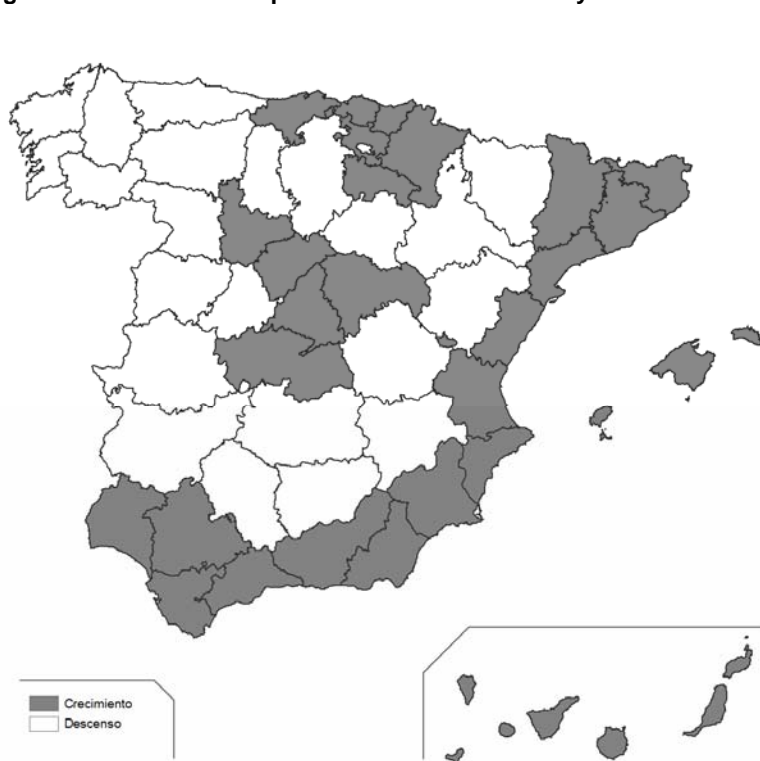
Figura 4. Evolución de la población rural entre 1991 y 2008

Nota: consideramos municipios rurales los menores de 10.000 habitantes.