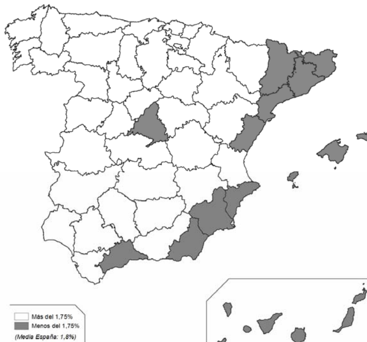
Figura 2. Los inmigrantes (residentes nacidos en el extranjero) como porcentaje de la población rural, 2000

Nota: consideramos municipios rurales los menores de 10.000 habitantes.