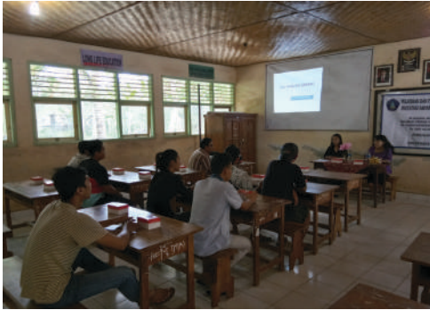
Foto 1. Peserta antusias menyimak

peserta pelatihan aktif berdiskusi dan menunjukkan minat yang serius serta ketertarikan mereka terhadap investasi saham. Aktifitas peserta pelatihan di sajikan pada dokumen-dokumen berikut: