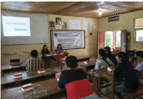
Foto 2. Penyampaian rangkuman materi

Kegiatan yang dilaksanakan setelah pelatihan adalah pendampingan yang akan dilaksanakan selama empat minggu sejak hari/tanggal Minggu tanggal 20 Agustus sampai dengan Minggu tanggal 3 September 2017. Kegiatan pendampingan dilaksanakan setiap hari Minggu pagi dari jam 09.00 sampai dengan jam 10.00 waktu Indonesia tengah. Teknis pelaksanaan pendampingan yakni taruna-taruni di bagi dalam empat kelompok dan setiap pendampingan yang didampingi hanya satu kelompok, dimana tiap kelompok terdiri dari empat sampai lima orang.