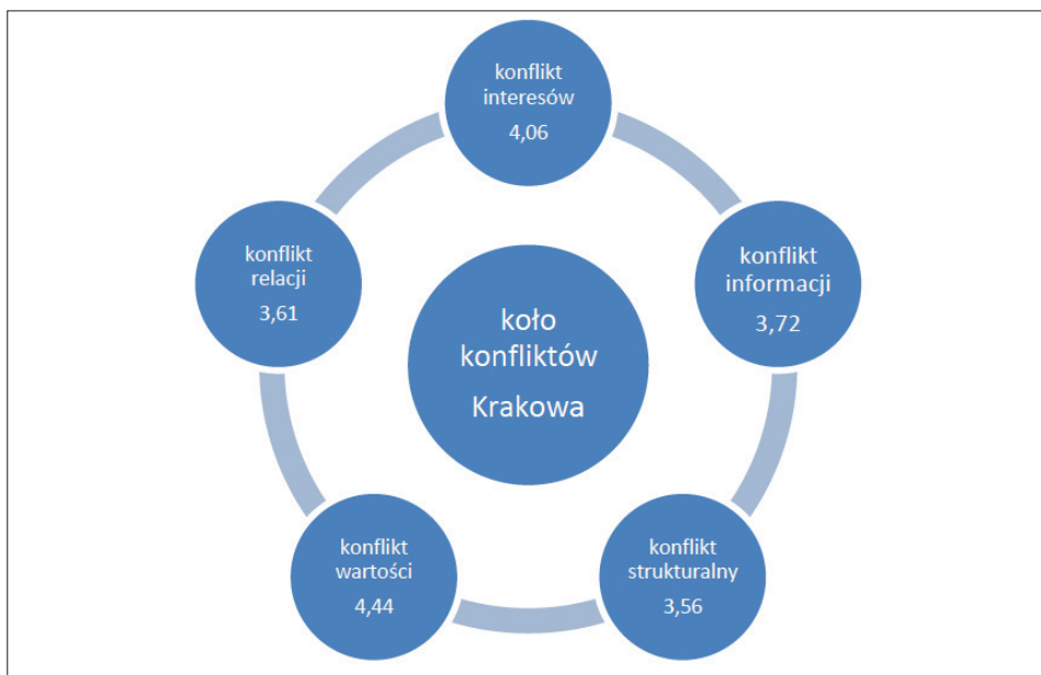
Ryc. 1. Koło konfliktów turystyki w Krakowie przed pandemią COVID-19 (opracowanie własne na podstawie Zmyślony, Kowalczyk-Anioł 2019)

W przypadku Krakowa próbę obliczenia natężenia konfliktów przedstawili P. Zmyślony i J. Kowalczyk-Anioł (2019, s. 15–16), co zobrazowano na ryc. 1. Najmniejsze nasilenie konfliktu dotyczyło konfliktów strukturalnych (3,56), a najwyższe – wartości (4,44) i interesów (4,06).