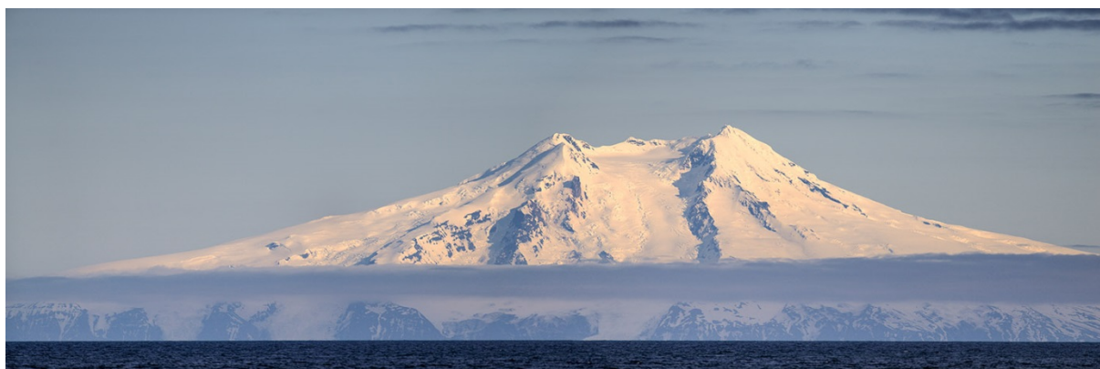
Vulkan Beerenberg auf Jan Mayen

Weite Teile des mehr als viertägigen Transits von Reykjavik nach Spitzbergen gleiten wir durch fast unheimlich spiegelglatte See. Lediglich ein unerwarteter südlicher Ausläufer der grönländischen Drifteisfelder bremst die ungehinderte Fahrt vorübergehend aus und bietet uns ein touristisch wertvolles Naturschauspiel – Sichtung von Delphinen und Walen inklusive! Eindrucksvoll auch der majestätische Vulkan Beerenberg auf Jan Mayen, der mit seinen über 2000 m Höhe Steuerbords längs zieht.