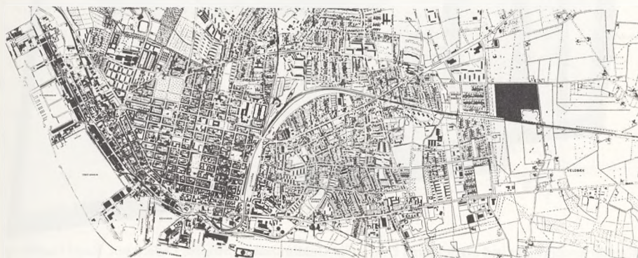
Kort over Esbjerg med Novrup kirkegård markeret sort.

Arbejdet blev i de følgende år udført i januar kvartal, hvilket betød, at en del af de personer, som var tilknyttet Esbjerg kirkegård, kunne få helårsarbejde.