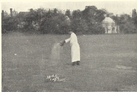
Fig. 34. Spredning af asken i engelsk Garden of Remembrance.

I forbindelse med de fleste Garden of Remembrance kan man på en eller anden måde få den afdøde mindet. Nogle steder kan man f. eks. få plantet et træ eller en busk, ved hvilken der så sættes en lille mindeplade for en betaling varierende mellem 150 til 500 kroner. Eller man kan få lov til at få anbragt et fuglebad eller en bænk. På et vist tidspunkt må man selvfølgelig sige nej tak til sådanne gaver, f. ex. dersom træerne kræves betalt med en stor overpris. Mere almindeligt er derfor ganske små minde-