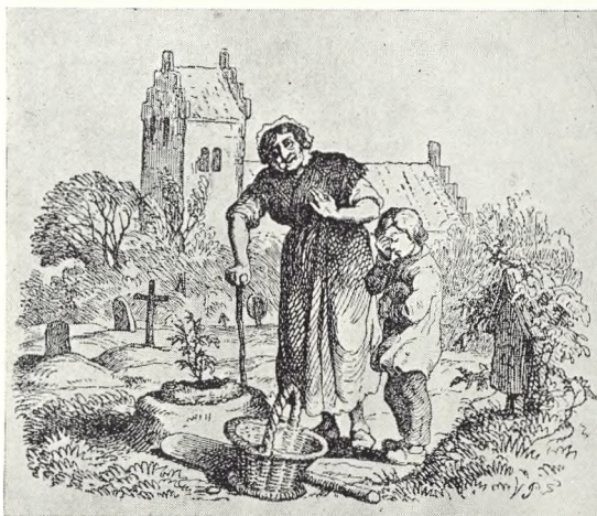
Fig. 100. Vilh. Pedersens illustration til »Hun duede ikke«.

Kirkegårdsbesøget her giver A. anledning til følgende betragtning: »At en Grav smykkes med en enkelt Krands, finder jeg smukt og betydningsfuldt; Tømmermanden sætter jo ogsaa sin Krands med det brogede Flitterguld paa Husets Tag, naar den hele bygning er reist; hvorfor skulde vi da ikke, ligesom han, ogsaa her sætte en Krands; Graven er dog Taget