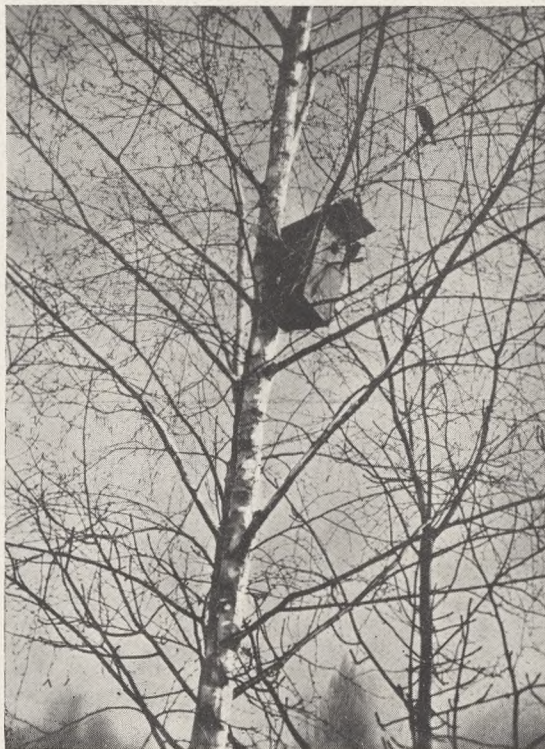
Fig. 98. Starekasse i Birketræ.

Af alle disse er kvækerfinken, grønsisk-