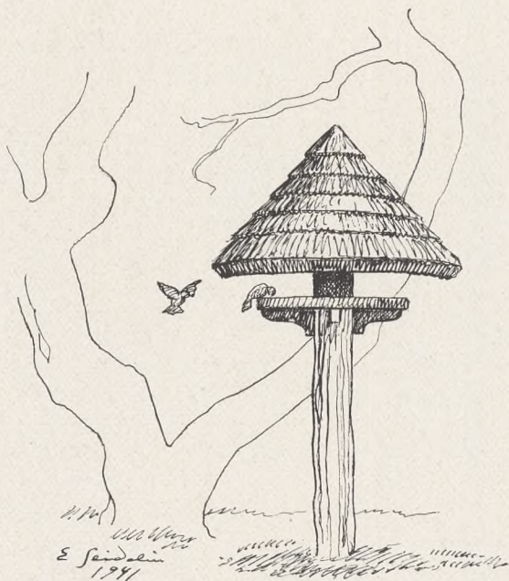
Fig. 96. Fuglefoderplads paa Mariebjerg Kirke- gaard i Gentofte. Efter Tegning af E. Seidelin.

er paa Kvibergskyrkogården i Göteborg i September 1944 jordet 99 Tyske fra Sænkningen af »Westphalen«, og (skønt ikke Deltager i den store Krig) har Landet ogsaa faaet sine egne Soldatergrave, — Grave for dem, der faldt under Udøvelse af deres Vagt for Konge, Folk og Rige.