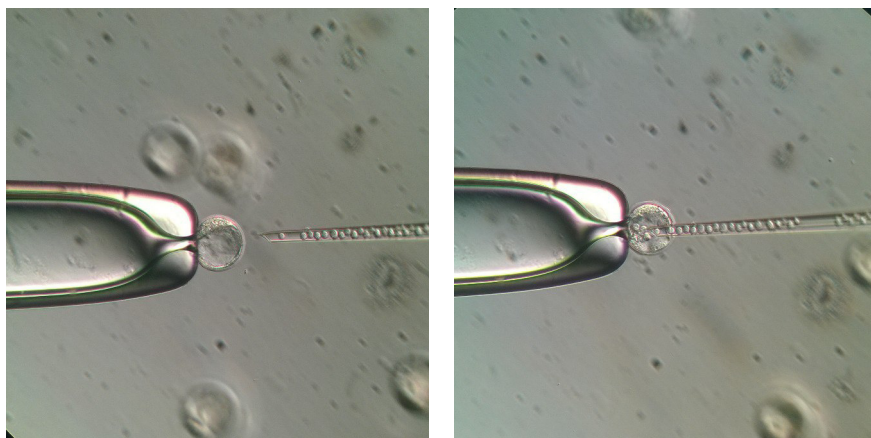
Fig. 1. Microinjection of DGE51 ES cells into a mouse blastocyst.

ПЦР-анализ микросателлитов. ДНК из хвостов мышей и из культур ЭС клеток выделяли лизированием в буфере (100 mM NaCl; 10 mM Tris-HCl, pH 8.0; 10 mM EDTA; 0.5 % SDS) с добавлением протеиназы К (конечная концентрация – 1 мкг/мл). Пробирки инкубировали при темпе-