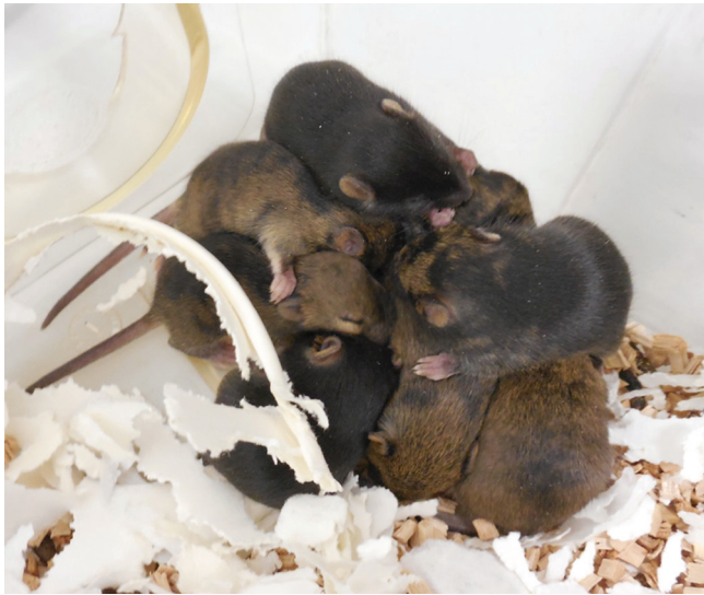
Fig. 2. Male chimeras born after DGE51 ES cell microinjection into a mouse blastocyst.

Agouti (brown) patches of coat color indicate the contribution of DGE51 cells with the dominant agouti allele to animal tissues.