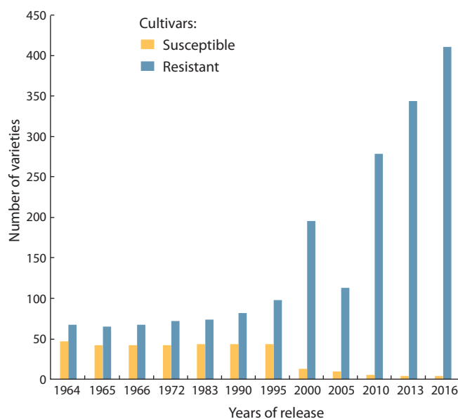
Fig. 1. The numbers of potato cultivars resistant and susceptible to S. endobioticum (pathotype 1) that were released from 1964 to 2016 according to the State Register of Selection Achievements.

Разработка лабораторных методов оценки ракоустойчивости картофеля была начата еще в 1920-х гг. А. Spieskermann и Р. Kothoff (1924) предложили проводить заражение клубней возбудителем рака в специально приготовленном компосте, содержащем зимние зооспорангии патогена. В 1925 г. М.Д. Глупне впервые использовала