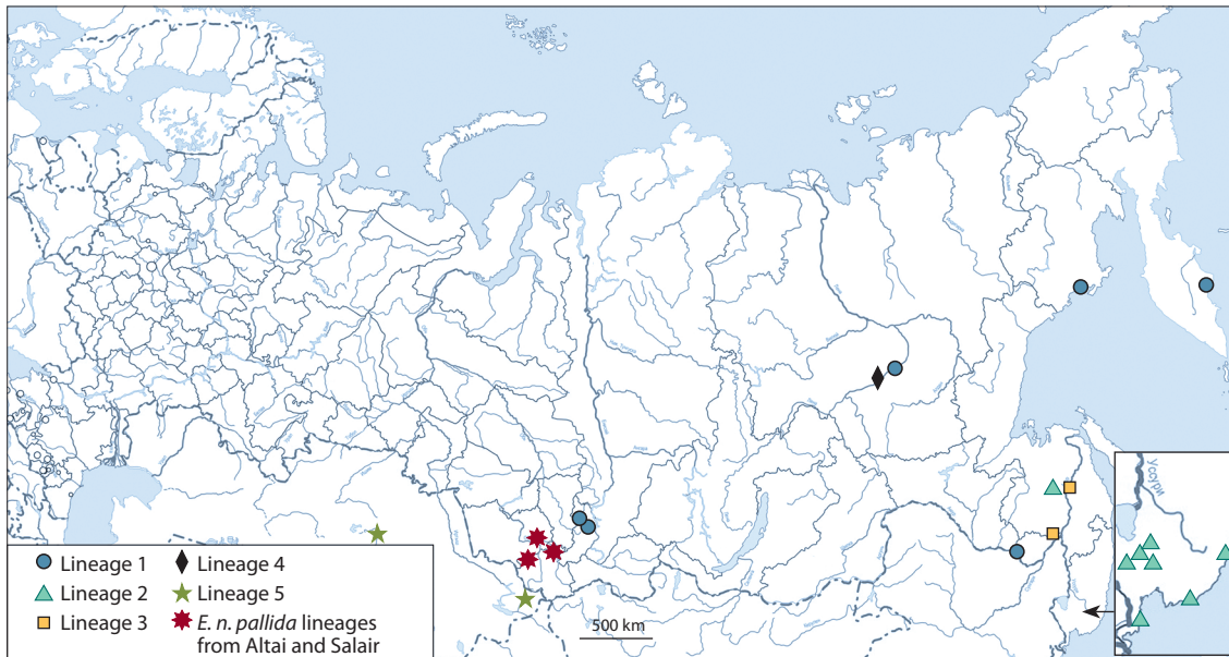
Fig. 2. The distribution of E. n. pallida lineages.

1994; Perel, 1987; Всеволодова-Перель, 1997): в частоте и амплитуде спонтанной сократительной активности мышц мускульного желудка, а также в холинорецепторных и адренорецепторных характеристиках. Считается, что E. n. pallida имеет диплоидный набор хромосом ( 2n = 36 ), тогда как номинативный подвид – полиплоид (Kashmenskaia, Polyakov, 2008; Всеволодова-Перель, Лейрих, 2014). Оба подвида E. nordenskioldi имеют высокую холодоустойчивость, однако у E. n. pallida она несколько ниже (Берман, Мещерякова, 2013; Мещерякова, Берман, 2013).