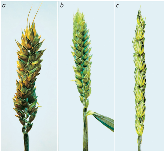
Fig. 1. SCR-morphotype spikes of lines: (a) Rus. 34-11 and (b) Rus. 30-11; (c) a standard spike of cv. Novosibirskaya 67.

порядок расположения листьев или отличаться от него. Для всех видов семейства злаков характерно очередное образование листовых зачатков под углом 180^\circ друг к другу, а латеральные структуры соцветия у большинства видов формируются по спирали с меньшим углом (Kellogg et al., 2013). Исключением являются представители Pooideae, включая пшеницу, ячмень, рожь; у видов этого подсемейства смена филлотаксиса не происходит, что приводит к формированию двурядного соцветия (колоса у пшеницы, ячменя, ржи) (Bonnett, 1936). Е.А. Kellogg с коллегами (2013) показали, что такой тип филлотаксиса характерен более чем для 3000 видов Pooideae и исключением является только один вид. Морфология и генетика «переключения» филлотаксиса интенсивно изучались у кукурузы и риса (Ikeda et al., 2005), однако о генетических механизмах, регулирующих филлотаксис соцветия видов подсемейства Pooideae, известно очень мало (Kellogg et al., 2013). Показано, что мутация cul2 (6Н) подавляет развитие дополнительных побегов и приводит к изменению филлотаксиса соцветия ячменя (Babb, Muehlbauer, 2003), однако других данных о генетическом контроле филлотаксиса видов подсемейства Pooideae в настоящее время в литературе нет. Основная причина, по-видимому, – это отсутствие форм с измененным филлотаксисом.