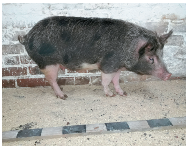
Fig. 8. A black-spotted sow with dark gray background color at the age of one year. The same sow at the age of one month can be seen in Fig. 6 d.

расцветок вполне может осуществляться одной генетической системой с неспецифическим, не различающим фео- и эумеланин, эффектом. Однако динамики процессов синтеза и ингибиции пигментов, скорее, указывают на два отдельных генетических механизма, работающих с разными пигментами. Для феомеланина, очевидно, характерны интенсивный синтез в пренатальный период