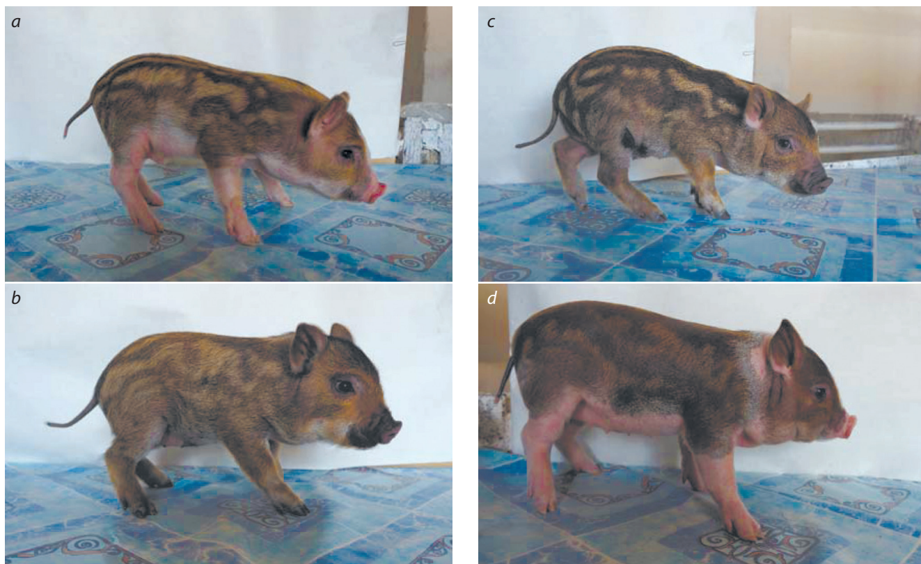
Fig. 5. Piglets of ICG mini pigs with aberrations in the juvenile livery pattern.

Мини-свиньи ИЦиГ псевдодикой масти, как правило, имеют черные пятна, т. е. являются гетерозиготами E^+/E^P по локусу MC1R (Никитин и др., 2016). Аллель E^P обеспечивает черно-пеструю масть, для которой характерно хаотическое расположение черных пятен, поэтому логично предположить, что взаимодействие аллеля E^P с аллелем E^+ или аллелем A локуса ASIP , либо оба таких взаимодействия, увеличивает случайную вариацию в рисунке ювенильной ливреи. Можно также предположить, что существуют генетические факторы, не относящиеся к локусам ASIP и MC1R , которые увеличивают неопределенность реализации рисунка ювенильной ливреи. Однако вопрос о том, какое из перечисленных предположений верно, может быть решен только в результате дальнейших исследований.