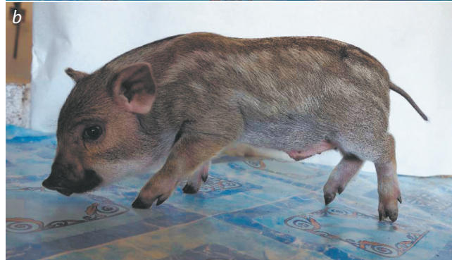
Fig. 3. Piglets of ICG mini pigs with reduced pheomelanin production.