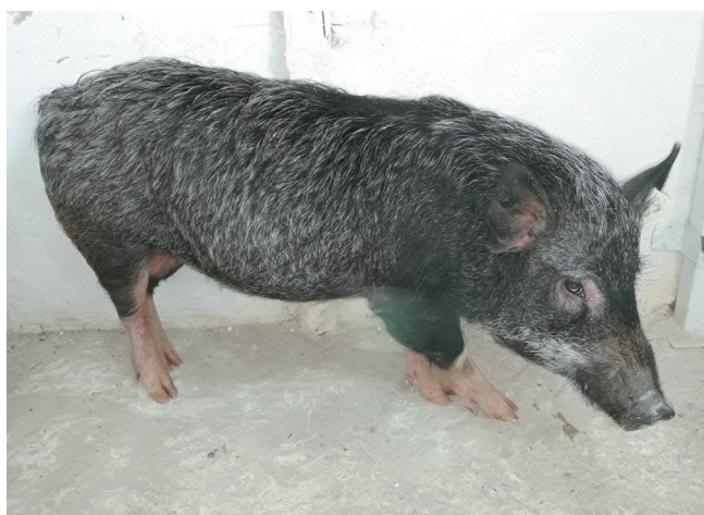
Fig. 7. A pseudoagouti boar devoid of the yellow pigment at the age of one year. The same boar at the age of 1 month can be seen in Fig. 3 a.