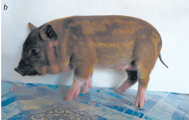
Fig. 2. Piglets of ICG mini pigs with a high concentration of pheomelanin in the hair.