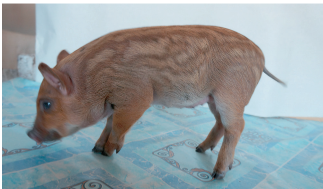
Fig. 1. A piglet of ICG mini pigs with a combination of colors (red and brown) close to that in the wild boar.