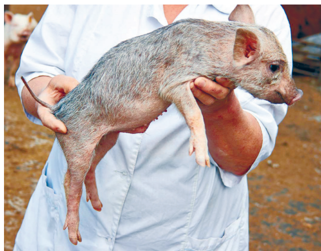
Fig. 4. A piglet with light gray roan color, almost white.