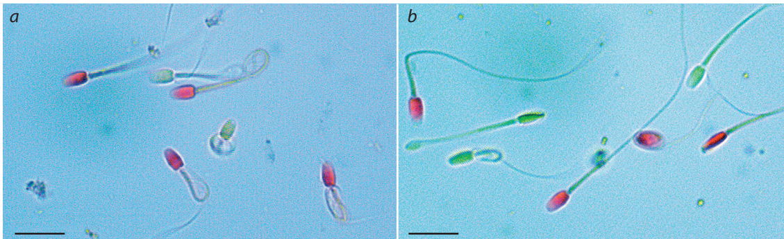
Fig. 1. Assessment of the viability of frozen-thawed domestic cat spermatozoa after staining with VitalScreen.

Образцы семени, замороженные двумя способами, не отличались по доле морфологически нормальных и ано-