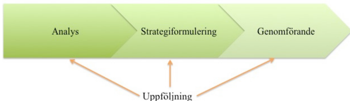
Figur 3: Strategi som plan (egen bearbetning).

Bruzelius & Skärvad (1995) menar att ett annat perspektiv på strategi är att den ses som en förbestämd, planerad och dokumenterad process gällande handlingar som ska utföras av företaget. Denna process är indelad i tre faser som är analysfasen, strategiformuleringsfasen och genomförandefasen, vilket illustreras i figur 3. Uppföljning av de olika faserna bör ske kontinuerligt under processens gång (Bruzelius & Skärvad, 1995).