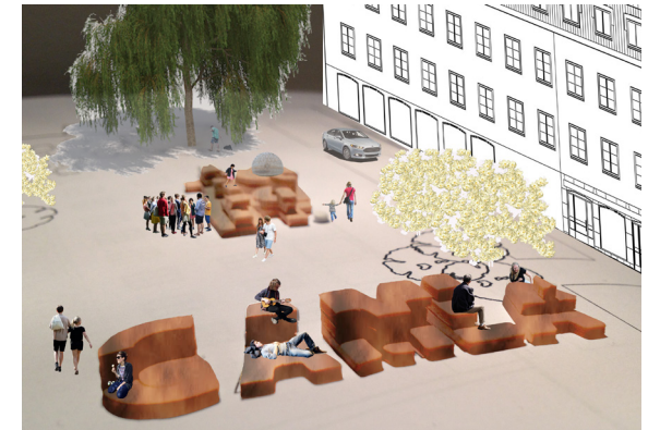
View towards northeast

Literature search was made to find information related to the project's keywords, with the intention to create a clear link between performance and results.