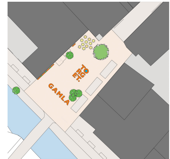
Design proposal of the square, plan

I have chosen to show my work as posters since landscape architects use this as a presentation technique in their profession.