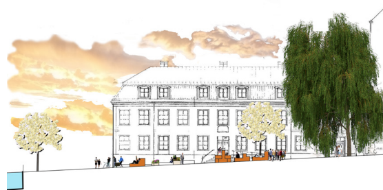
View towards northwest.

In Uppsala city, close to the biggest shopping street in close proximity to Fyrisån river you find Gamla torget. It's a city square that has been a key point in my everyday life as a citizen of Uppsala. But when I thought about it I have never actually ever stayed in the square for any purpose other than to park my bicycle. When I observed other peoples behaviour, it seemed to be common that Gamla torget was more of an passageway than a location where people would stay.