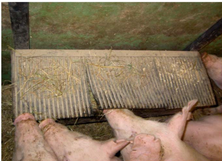
Bild 1. Aktivitet vid stora bökboxen (Andersson och Karlsson, 2010).

Andersson och Karlsson (2010) konstruerade en bökbox, som sedan fylldes med höensilage eller hö, för att stimulera grisarnas bökbeteende och undersökningsbeteende och genomförde därefter en observationsstudie på grisar. Bökboxen var helt enkelt en plåtlåda med ett tungt lock av gummispalt, som används till kor att stå/ligga på. Andersson och Karlsson (2010) tillverkade två bökboxar, en mindre och en större, och locken var delade i tre respektive två delar. Boxarna sattes fast i två järnstänger som gick upp över kanten på boxen och ned på andra sidan och hängde ca 26 centimeter över golvet (se bild 1).