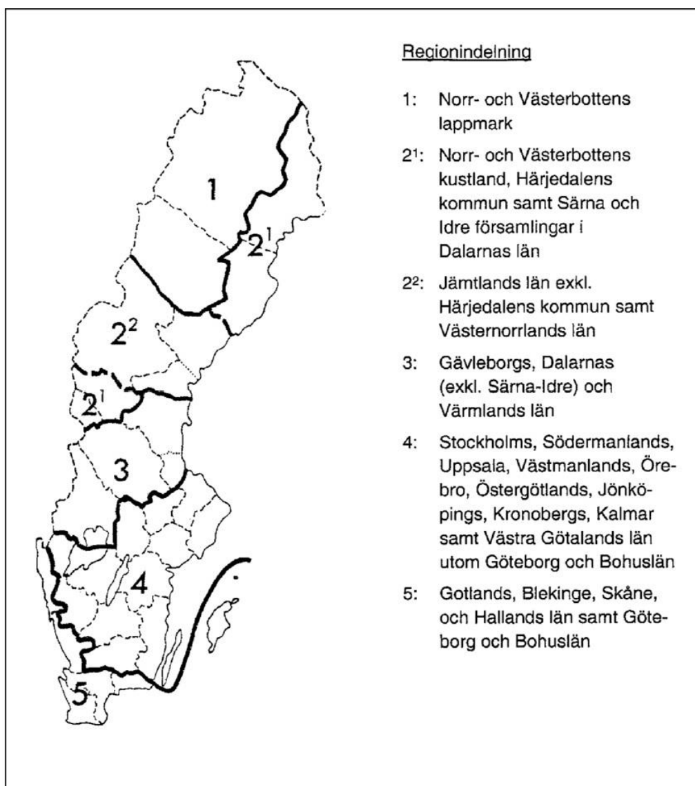
Figur 1 Riksskogstaxeringens regionsindelning.

I studien har 5144 av Riksskogstaxeringens (RT) provytor använts som referensytor. Bland dessa finns både permanenta (4939) och tillfälliga (205) ytor. De permanenta inventeras med 5 års intervall och har en provyteradie på 10 meter och de tillfälliga har en provyteradie på 7 meter. Ytorna är fördelade över hela landet på 5 regioner, se figur 1. Resultat beräknas enligt denna regionsuppdelning.