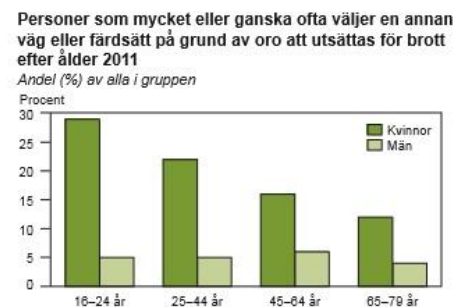
Fig. 3 Statistiska centralbyråns statistik (2012) visar på att fler kvinnor än män på grund av oro att utsättas för brott tar en annan väg.

Enligt Listerborn (2000) är tillgänglighet och orienterbarhet två viktiga utgångspunkter på hur en tryggare stadsmiljö kan skapas. En tillgänglig stadsmiljö innebär enligt henne att underlätta för människor att förflytta sig i staden och delta i det offentliga livet. Vidare säger Listerborn att det ska vara lätt och tryggt att röra sig mellan olika funktioner i samhället genom korta och direkta förbindelser. Hon beskriver att exempelvis trafikstruktur och busshållplatsers placering därför är betydelsefullt. Enligt Listerborn kan det även vara bra med så kallade alternativvägar, vilket innebär att det finns möjlighet att välja en alternativ väg om man är rädd att gå en viss sträcka. Hon argumenterar för att detta är viktigt för att individens rörelsefrihet inte ska begränsas. Enligt Statistiska centralbyråns (2012) statistik (Fig.3) väljer kvinnor i större utsträckning än män en alternativ väg av rädsla för att utsättas för brott, vilket tyder på att det offentliga rummet inte är lika tillgängligt för alla.