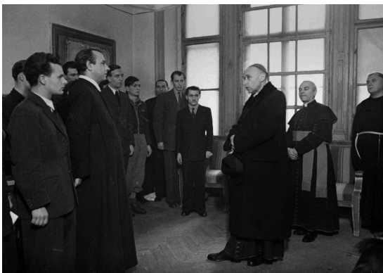
Mindszenty József hercegprímás látogatása az Új Ember szerkesztőségében 1947-ben. Balra közepén Péntes Balduin főszerkesztő

Január 20-án Mindszenty a Szent Domonkos-templomban mondott misét, amelyen Hámori László, a Népszava munkatársa is jelen volt. 24 Az újságíró szerint Mindszenty párhuzamot vont a tatárok és a szovjet hadsereg tagjai között, külön kiemelve a lakosság ellen elkövetett atrocitásokat. 25