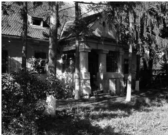
A sepsizoltáni Benkő-kúria Váradi József rejték helyével napjainkban.

a két rejtéket, ülőkéket is képezve a fal téglájából, hogy azokban állva és leülve is kényelmesen elfért egy ember. 62