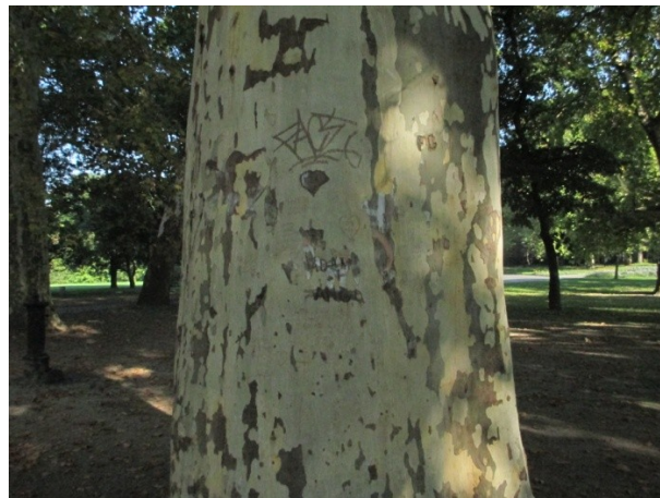
1. ábra: Margitszigeti platánfa rongálva Figure 1. Sycamore tree on the Margaret Island, Budapest, Hungary

Magyarországon közparkokban, régi kastélykertekben tömegesen használt díszfa, főleg a juhar levelű-, de néhol a keleti platán is. Az 1900-as évek elején az út menti fásítások idején fasorokként, illetve parkokba csoportokként ültették, de mára sok közülük a közlekedés okozta szennyezés és az utak sózásának áldozata lett. Néhány városban még megmaradtak a platánfasorok vagy csoportok, mint például a Balaton partján Balatonboglárnál, Budapesten, az Andrássy úton, a Nagykörúton és a Margitszigeten, Gödöllőn (ALMÁSI et al. 2014), Kiskunfélegyházán. Ezen kívül sok városban található még magányos öreg platánfa például Eger, Tata, Alsóbogát, Letenye, Pápa, Kőszeg, Körmend, Gyula, Füzérradvány. Az antropogén hatások a mai napig veszélyt jelentenek ezekre a fákra, ezek közül a legnagyobb probléma a rongálás. A sima kéregbe sokan belekarcolnak vagy belevésnek, de a platán fák kérge igen vékony és ezzel előidézhetik a farontó spórák meglepedését. További probléma, hogy a lelógó ágakat a gyerekek mászóknak használják, illetve a turisták előszeretettel fényképeződnek az ágakon ülve (HTTP6-8).