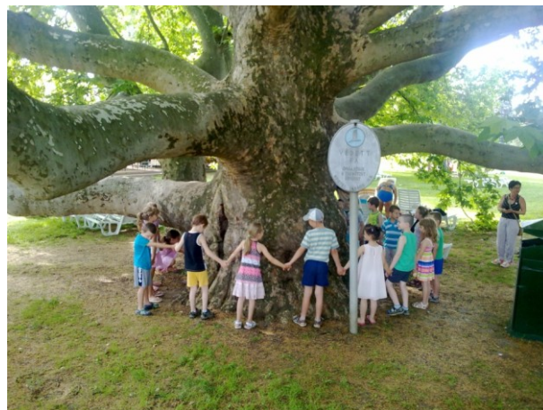
3. ábra: Egri platánfa a termálfürdő területén

Egerben egy keleti platánt jelöltek meg év fájának mely a termálfürdő területén található (3. ábra). A fa az Eger patak közelsége és az altalaj kedvező vízellátottsága miatt nagyon jól érzi magát élőhelyén. A fát Eszterházy Károly (1725–1799) egri püspök idején telepítették. A platánfát 1978-ban Heves megye Tanács Végrehajtó Bizottsága Védetté nyilvánította. A védetség fenntartásáról Eger Megyei Jogú Város közgyűlése 2007-ben döntött (HTTP9) jogilag, táblát helyeztek ki, és büntetést szabnak károkozás esetén (GYURÁKI 2011).