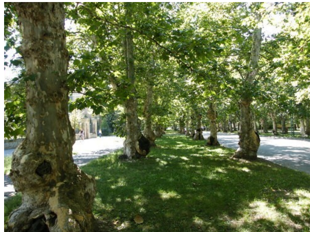
7. ábra Kossuth utcai platánfasor Kiskunfélegyháza Figure 7. Sycamore tree row of Kiskunfélegyháza, Hungary

Kiskunfélegyháza védett fasorai közül a legelső és a legismertebb a Kossuth utcai platánfasor (7. ábra). A városházától a vasútállomásig vezető utcát szegélyező juharlevelű platánfasort a 19-20. század fordulóján telepítették. A fák ápolásra szorulnak, sok helyen fertőzöttek. A főutca forgalma miatt gyorsan szennyeződnek, így a gombás megbetegedések szinte minden fánál előfordulnak. A probléma megoldásán az önkormányzat szakemberei dolgoznak.