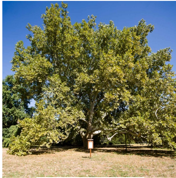
6. ábra Cégénydányádi öreg hölgy Figure 6. Sycamore tree in Cégénydányád, Hungary

Zsigmond ültette az 1800-as években, amikor is a kastélyhoz tartozó angol kertet telepítette (HTTP9).