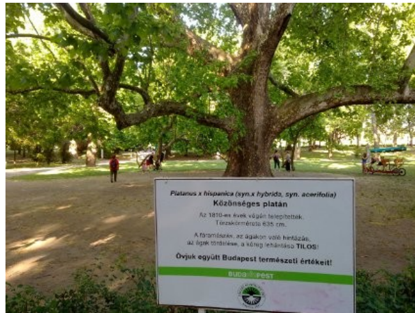
2. ábra: Margitszigeti 200 éves fa

Figure 2. The 200 years old sycamore tree on Margaret Island, Budapest, Hungary