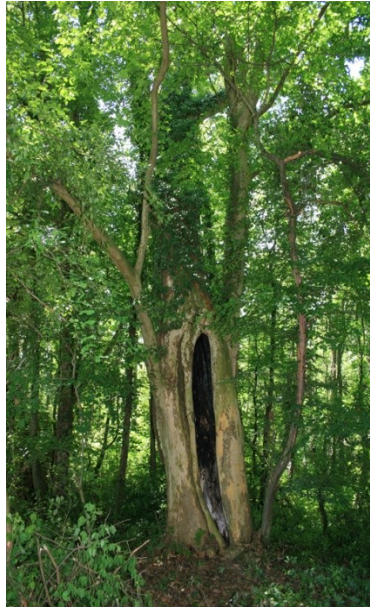
4. ábra: Alsóbogáti platán Figure 4. Sycamore tree in Alsóbogát, Hungary

A tatai nagy platánfa (5. ábra) említésekor a környékeliek mind az Öreg-tó partján álló méltóságteljes óriásplatánra gondolnak, mely a vár délnyugati kapujának közelében áll majd 230 éve. A fát több társával együtt Versailles-ból hozatták Esterházy Ferenc megbízásából. A fa 19 m magas és 650 centiméteres a törzskerülete. Védelmét Tata város önkormányzata biztosítja (HTTP9).