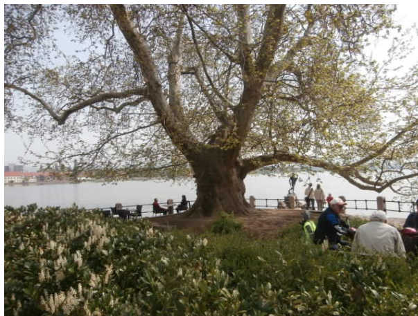
5. ábra: Tatai platánfa Figure 5. Sycamore tree in Tata, Hungary

A tatai nagy platánfa (5. ábra) említésekor a környékeliek mind az Öreg-tó partján álló méltóságteljes óriásplatánra gondolnak, mely a vár délnyugati kapujának közelében áll majd 230 éve. A fát több társával együtt Versailles-ból hozatták Esterházy Ferenc megbízásából. A fa 19 m magas és 650 centiméteres a törzskerülete. Védelmét Tata város önkormányzata biztosítja (HTTP9).