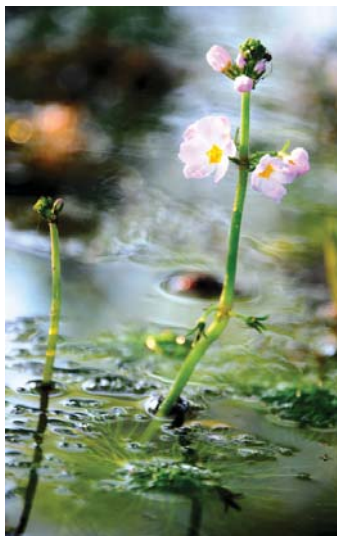
8. ábra Békaliliom ( Hottonia palustris ), Kiskőrösi-turjános Természetvédelmi Terület, Kiskunsági Nemzeti Park Igazgatóság

következtében igen kevés terület őrizhette meg egykori jellegét. Ezen gyöngyvirágos tölgyesek egykori hírmondója a Szücsi-erdő.