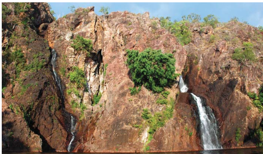
3. ábra Wangi vízesés, Litchfield Nemzeti Park, Ausztrália északi tartományában Figure 3. The Wangi Falls in Litchfield National Park, Northern Territory of Australia

Az itt fellelhető természeti kincsek közül megemlíthető a Florence vízesés, melynek tavában úszni is lehet. Ezen kívül még számos vízesés meglepően látványos, mint a Wangi vízesés (3. ábra) a Walker-patakkal, vagy a Tolmer vízesés. Lenyűgöző látvány a Buley Rockhole, amely apróbb vízesések, és vízzel telt sziklaüregek sorozata. Az Elvesztett Város a homokkőpilléirevel az itt élt civilizációk tanúja.