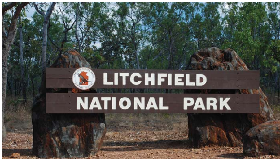
2. ábra A Litchfield Nemzeti Park bejáratát jelző tábla Ausztrália északi tartományában Figure 2. The entrance sign at Litchfield National Park in the Northern Territory of Australia

A gazdag történelemmel és kultúrával átitatott tájat a víz és az idő alakította ki. Több ezer évig az ausztrál őslakosok éltek itt, és formálták a tájat (HTTP5).