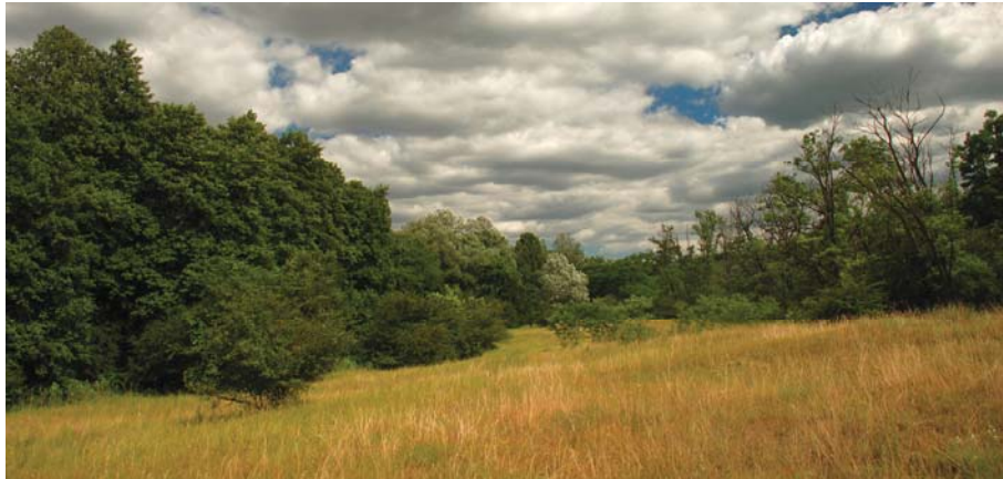
7. ábra A Gödöllői Dombvidék Tájvédelmi Körzet egyik Natura 2000 területe Erdőkertes közelében

janka tarsóka ( Thlaspi jankae ), mely egy bennszülött fajunk, ill. a bársonyos kakukkszegfű ( Lychnis coronaria ).