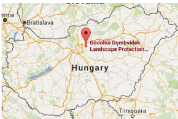
6. ábra A Gödöllői Dombvidék Tájvédelmi Körzet elhelyezkedése

A tájvédelmi körzetet 1990-ben alapították, összesen 11.801 ha kiterjedéssel, melyből a fokozottan védett terület összesen 802,6 ha-t tesz ki. A tájvédelmi körzetet a kiemelt természeti, valamint kultúrtörténeti értékek megóvása érdekében hozták létre (MALATINSZKY 2011).