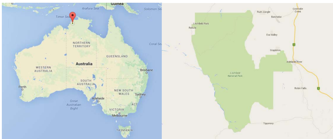
1. ábra Litchfield Nemzeti Park elhelyezkedése Ausztrália északi tartományában Figure 1. The location of Litchfield National Park in the Northern Territory of Australia

Ausztrália északi részén terül el, Batchelor nevű településhez közel, megközelítőleg 150.000 ha kiterjedésű. Évente 260 000 látogató érkezik a nemzeti parkba.