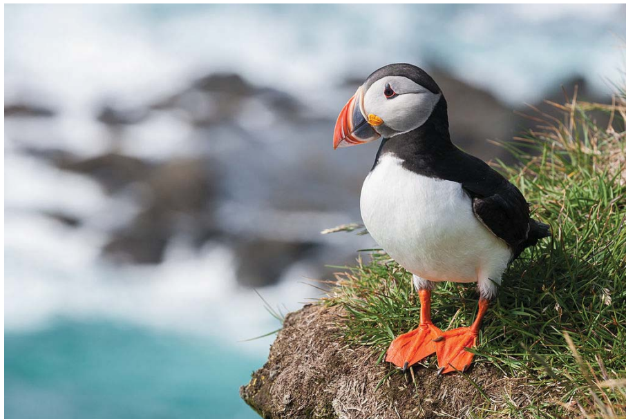
"Papageitaucher Fratercula arctica " by Richard Bartz - own work. licensed under cc by-sa 3.0 via wikimedia commons – HTTP 12

A Puffin-sziget Írországban, Kerry megyében helyezkedik el. A sziget 1,6 km hosszú és 0,7 km széles, és 145 méterre emelkedik ki a tengerből. 1987-ben nyilvánították védetté a BirdWatch Ireland kezdeményezésére. A védettséget a területén található tengeri madár populációk megőrzésének érdekében kapta, három madárfajnak jelentős fészkelő állománya itt található meg. A szigeten fészkel a lunda ( Fratercula arctica ) kb. 5000-10000 egyed; ezen madárfaj hím egyedei nyáron könnyen felismerhetők a színes csőrükről (6. ábra). Megtalálható még az atlanti vészmadár ( Puffinus puffinus ), és a viharfecske ( Hydrobates pelagicus ) kb. 20.000 egyede is, mely az európai vizek legkisebb viharfecskéje, csupán molnárfecske méretű (HTTP11).