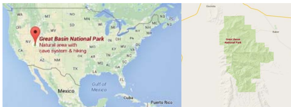
5. ábra A Great Basin Nemzeti park elhelyezkedése Figure 5. The location of Great Basin National Park

A Great Basin Nemzeti Park az Amerikai Egyesült Államokban, Nevada állam keleti részén található (5. ábra). Nevét a Sierra Nevada és Wasatch hegység közötti száraz hegyvidéki régióról kapta. Területe 31,2 hektár (HTTP7).