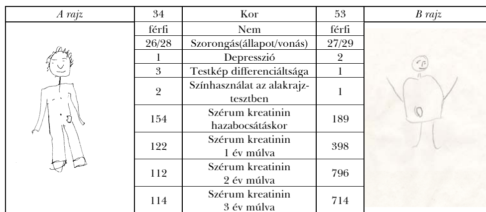
4. táblázat. Két transzplantált páciensünk ember- és szervrajza a posztoperatív időszakból, a hozzájuk tartozó pszichológiai és orvosi adatokkal

A rajz: A műtétet követő 3 évben nem fordult elő kilökődési reakció, továbbá a szérumban kreatinin érték 180 \mu\text{mol/l} alatti értéket mutat. B rajz: Több rejekeciós epizódot észleltünk a műtétet követő 3 évben, és a veseműködést jelző szérumban kreatinin szint átlagosan nagyobb, mint 180 \mu\text{mol/l} .