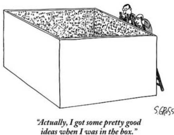
1. ábra. Sam GROSS, 2006. The New Yorker, Cartoon Bank, item #8545464.

A humor és a kreativitás kapcsolatára valószínűleg Auguste Penjon, francia filozófus figyelt fel először, akinek híres állítása 1891-ből – „a nevetés semmi más, mint a szabadság kifejezése, amelyet átélünk, vagy amire vágyunk” – a szokásos racionális gondolkodástól való elszakadásra vagy „kognitív játékosagra” való utalásként értendő (ZIV, 1989, 105).