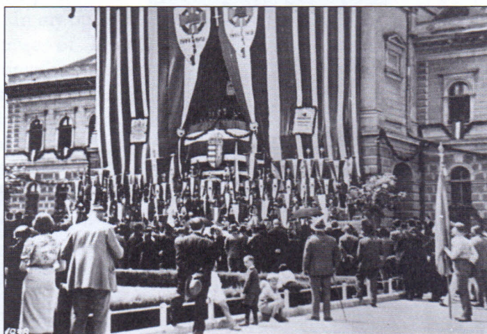
3. kép A szentesi Hősök Emlékünnepé, Megyeháza 1938.