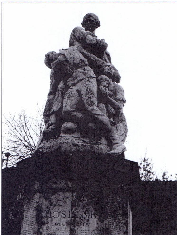
1. kép A Hősi Emlékmű – Szentes, Erzsébet tér, 2013.