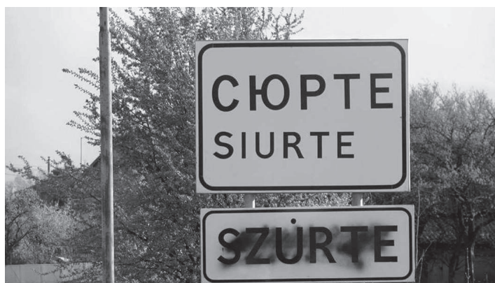
7. ábra: Megrongált helynévtábla Szürtében

Hamarosan azonban a többségi társadalom név és arc nélküli aktivistái – a muszalyihoz és beregszászihoz hasonló módon – kifejezésre juttatták elégedetlenségüket a nyelvi tájképet szerintük rossz irányba átalakító önkormányzati kezdeményezéssel szemben. Ezek az ismeretlenek úgy vélték, a magyar helységnevek feltüntetése Kárpátalján sérti az ukrán nyelv hegemoniáját, ezért több község határában fekete festékkel fújták le a többnyelvű táblákon látható magyar feliratot, 17 többek között Szürtében is (7. ábra).