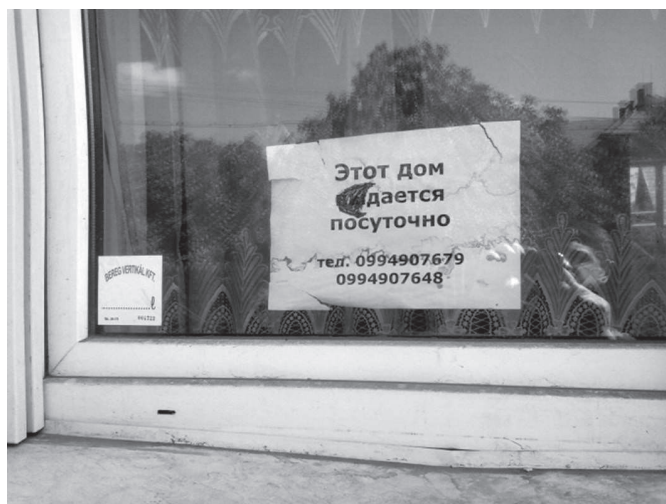
16. ábra: Korrigált orosz nyelvű felirat (Beregszász)