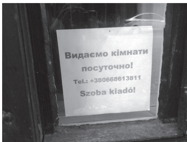
11. ábra: Ukrán és magyar nyelven kínált szálláshely Zápszonyban

A globális angol mellett természetesen az államnyelven, ukránul kínált szálláshely is akad bőven. Az ezeket reklámozó feliratok, kiírások egy része ukrán–magyar két-nyelvű (11. ábra), de túlnyomó többségük csak ukrán nyelven jelenik meg, például a szintén főként magyarok lakta Déda községben (12. és 13. ábra) vagy éppen Nagybégányban (14. ábra).