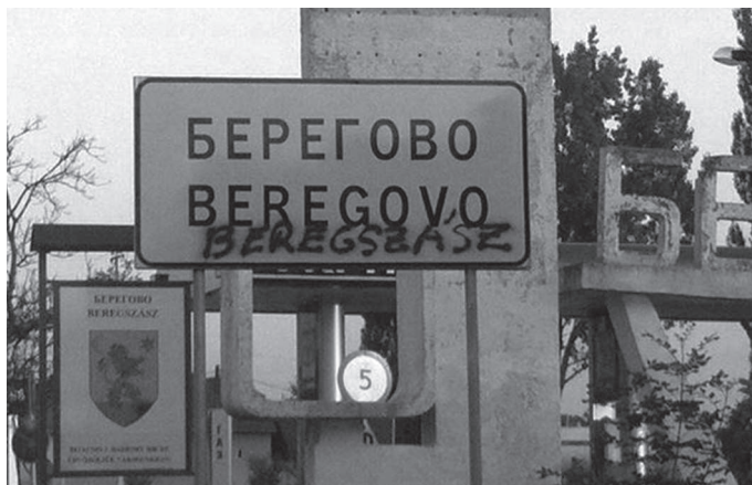
3. ábra: Beregszász festékszóróval korrigált helynévtáblája

Hasonló történt Beregszász határában is. Amint az a 3. ábrán látható, ismeretlenek a Beregszász feliratot is felírták az ukrán Берегово és a szláv névváltozatból transliterált Beregovo alá, mert – ahogyan az egyik blogbejegyzés szerzője fogalmazott – „Beregszász azért csak Beregszász, s nem Beregovo”. 16