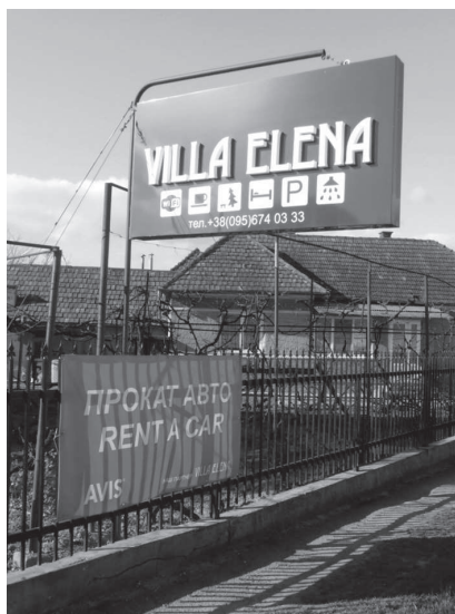
10. ábra: Angol és ukrán nyelven hirdetett autókölcsönző Jánosiban

A 10. ábra alapján az is kiderül, hogy a megnövekedett turistaforgalom a kínált szolgáltatások körét is jelentősen bővítette: itt nemcsak szállásra lelhetünk, hanem akár gépkocsit is kölcsönözhetünk. Minderről ukrán és angol nyelven is tájékozódhatunk.