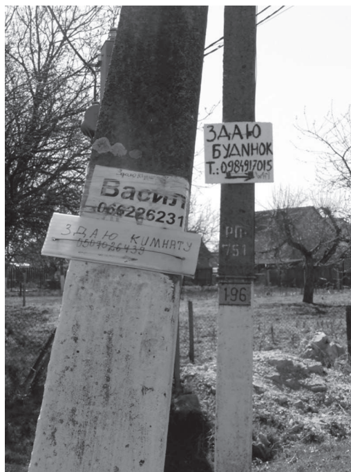
12. ábra: Kiadó szálláshelyek reklámfeliratai Dédában

A dinamikusan változó nyelvi tájkép: Kárpátalja példája