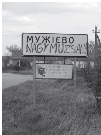
2. ábra: Muzsaly korrigált névtáblája

2008-ban azonban az állami közútkezelő a lecserélt helynévtáblákon több helyen a magyar településnevek helyett a cirill betűs ukrán névváltozatot írta át latin betűkkel. Ekkor (Nagy)muzsaly község neve az ukrán Мужієво „latinosítása” révén Muzhiyevo alakban került fel az új táblára a korábbi Muzsaly helyett. Amint arról a Kárpáti Igaz Szó című, Ungváron megjelenő lap 2008. március 6-i számában beszámolt, a táblára „a helybeliek nemes egyszerűséggel festékszóróval ráírták a település rendes magyar nevét” (2. ábra). 15