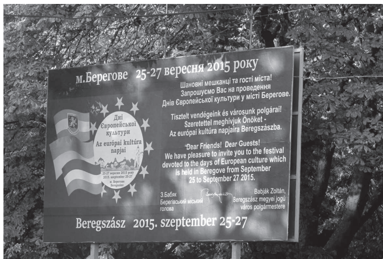
8. ábra: Háromnyelvű üzenet Beregszász központjában

A dinamikusan változó nyelvi tájkép: Kárpátalja példája