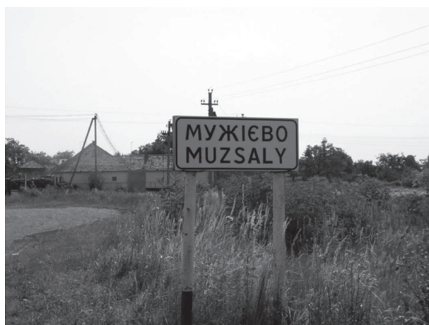
1. ábra: Kétnyelvű helynévtábla Muzsalyban

2008-ban azonban az állami közútkezelő a lecserélt helynévtáblákon több helyen a magyar településnevek helyett a cirill betűs ukrán névváltozatot írta át latin betűkkel. Ekkor (Nagy)muzsaly község neve az ukrán Мужієво „latinosítása” révén Muzhiyevo alakban került fel az új táblára a korábbi Muzsaly helyett. Amint arról a Kárpáti Igaz Szó című, Ungváron megjelenő lap 2008. március 6-i számában beszámolt, a táblára „a helybeliek nemes egyszerűséggel festékszóróval ráírták a település rendes magyar nevét” (2. ábra). 15