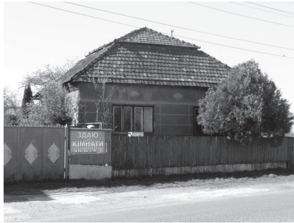
14. ábra: Ukránul reklámozott szálláshely Nagybégányban

A kaszonyi termálfürdő nyelvi tájképét elemző korábbi tanulmányunkban 26 bemutatottuk, hogy a Kárpátalja magyarok lakta részeire érkező szláv turisták jelentős része az orosz nyelvet használja. Nem véletlen tehát, hogy az orosz nyelv – amely a Szovjetunió széthullása után szinte teljesen eltűnt az egykori szovjet érdekszférából 27 és részben Kárpátaljáról is – ismét elkezdett megjelenni a régió nyelvi tájképében. Az orosz nyelvnek a turizmus általi (újra)megjelenése a posztszovjet térségben nem egyedi jelenség. Kutatók hasonlóról számolnak be a balti államokban, 28 illetve Magyarországon. 29 Ryazanova-Clarke szerint az orosz nyelv ismét megfigyelhető terjedése Oroszországon kívül annak transznacionális gazdasági értékével magyarázható. 30 A posztszovjet térségben így az orosz bizonyos fokig mindig betölti a lingua franca szerepét. 31 Hasonló lehet a helyzet Kárpátalján is.