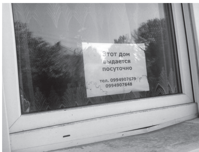
15. ábra: Magyar kontaktushatás egy orosz nyelvű kiírásban (Beregszász)

Mivel azonban az orosz nyelv használata az elmúlt negyedszázadban visszaszorult Kárpátalján, az iskolákban sem oktatják, felnőtt egy generáció, amely nem feltétlenül ismeri a sztenderd orosz. Ezzel magyarázható, hogy Kárpátalja magyarok lakta településein előfordul, hogy nem sztenderd orosz nyelvű kiírásokkal próbálják megszólítani az orosz nyelvű turistákat. A 15. ábrán látható orosz nyelvű felirat például a magyar nyelv logikája alapján készült. Az „Этот дом выдается посуточно” szöveg sztenderd orosz megfelelője az „Этот дом сдается посуточно” (a выдается a magyar ’kiadó’ szó tükörfordítása). Amint az a 16. ábrán látható, idővel valaki úgy korrigálta a nyelvi tájképet, hogy a sztenderd orosz szemmel nézve hibás feliratot kijavította.