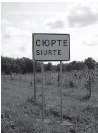
5. ábra: Szürte község magyar felirat nélküli névtáblája

Szürte község határában szintén olyan táblát állított fel a közútkezelő, melyen csak a falu ukrán neve ( Сюрте ), illetve annak latin betűkkel átírt, ám a helyi magyar nyelvhasználatnál nem egyező változata ( Siurte ) szerepelt (5. ábra). A helyi önkormányzat azonban saját hatáskörben korrigálta a helyzetet, és ugyanarra a táblára felszerelt egy újabbat, melyen már a község hagyományos magyar neve ( Szürte ) állt (6. ábra).