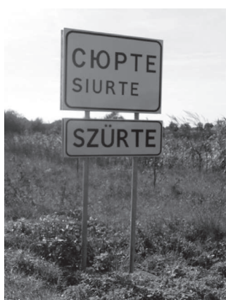
6. ábra: Kétnyelvű helysénvtábla Szürte határában