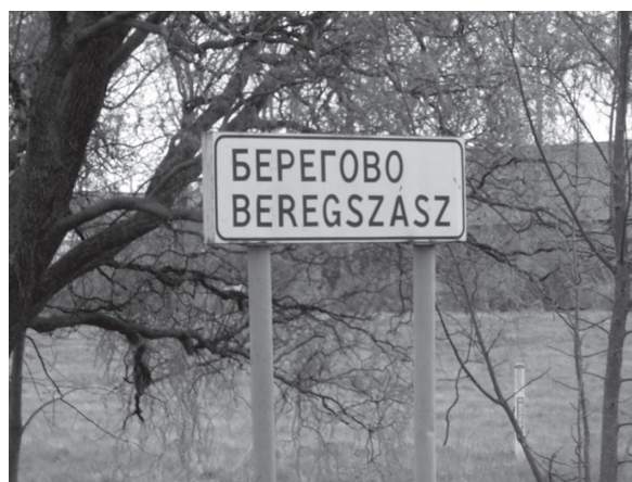
4. ábra: Kétnyelvű helynévtábla Beregszászban

Az ismeretlen és szervezetlen civilek által végrehajtott „gerillaakciók” nem maradtak hatás nélkül. Ma már Beregszász Munkács felőli határában olyan tábla áll, amelyen az ukrán mellett a közösség által használt magyar névváltozat van feltüntetve (4. ábra). Muzsalyban pedig ismét a település magyar nevével felülírt, az 1. ábráról már ismert tábla fogadja a községbe érkezőket.