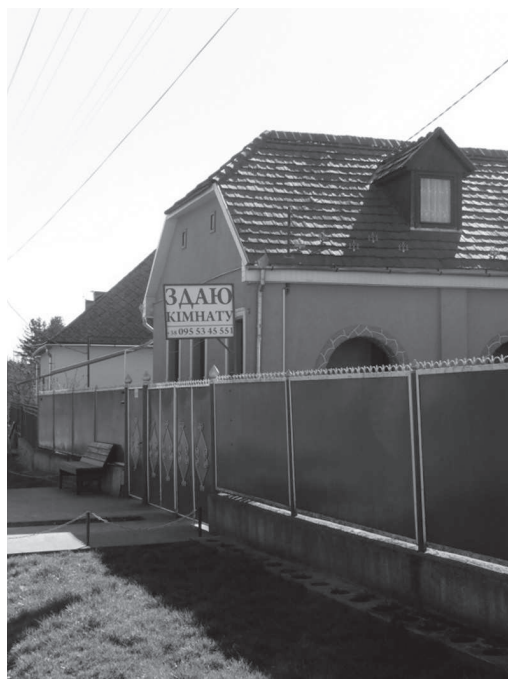
13. ábra: Szoba kiadó (ukrán nyelvű kiírás Dédában)