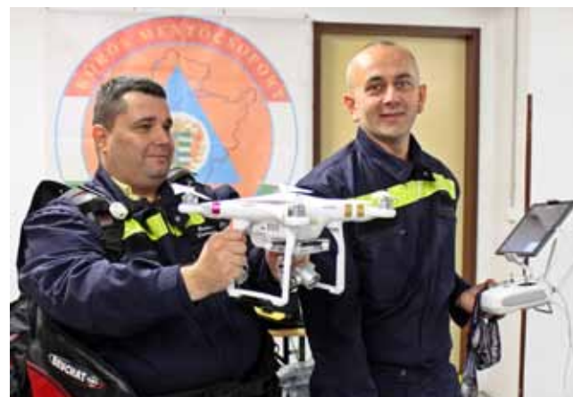
FELDERÍTÉSRE ALKALMAS DRÓN

A katasztrófavédelemről és a hozzá kapcsolódó egyes törvények módosításáról szóló 2011. évi CXXXVIII. törvény kimondja, hogy az „Önkéntes mentőszervezet: különleges kiképzésű személyi állománnyal rendelkező, speciális technikai eszközökkel felszerelt, katasztrófák és veszélyhelyzetek hatásainak kivédésére, felszámolására, katasztrófavédelmi feladatok ellátására, valamint emberi élet mentésére önkéntesen létrehozott civil szerveződés”.