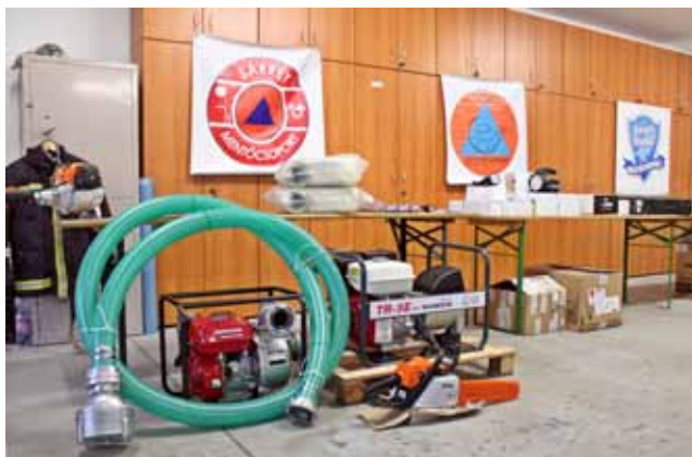
JÁRÁSI MENTŐCSOPORTOK PÁLYÁZOTT FELSZERELÉSEI

mentőcsoportok, főként alapvető vízkár elhárítási tevékenység céljából. Létrejöttük abból a szempontból különösen fontos, hogy az adott helyszínen élők képesek a leggyorsabban reagálni a veszélyre, és ők ismerik lakóköznyezetüket a legjobban.