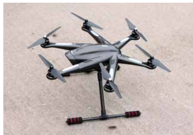
SOKOLDALÚAN FELHASZNÁLHATÓ A VEZETÉSI DÖNTÉSEKHEZ

Az építkezés alapjaként a már meglévő központi polgári védelmi szervezetek mellett megalakult Magyarország két központi mentőszervezete, a HUNOR Hivatásos Katasztrófavédelmi Mentőszervezet, amelynek munkájában önkéntesek is részt vesznek, valamint az önkéntesekből szerveződött, közepes kutató-mentő csapat, a HUSZÁR Mentőszervezet. A 2012-ben létrejött, mára 210 főt számláló HUNOR Mentőszervezet a hazai katasztrófavédelem elit egysége, Magyarország kormányzati mentőcsapata. Hivatásos nehéz kutató-mentő mentőszervezet, amelynek tagjai speciális mentési képességekkel bírnak, és több esetben küzdöttek már meg az áradó vízzel vagy a rendkívüli időjárás okozta veszélyekkel.