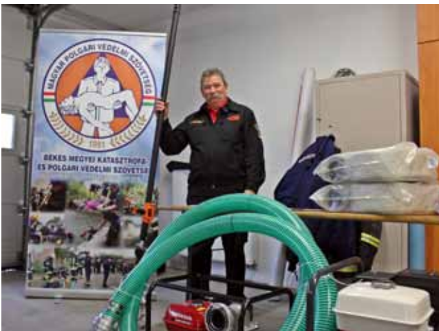
BÉKÉS MEGYEI SZÖVETSÉG

A mentőcsoporthoz fontos technikai eszközöket: drónt, quadot, mentőcsónakot, sőt nagy teljesítményű áramfejlesztőt is elnyertek a pályázat során, emellett a szervezetek csapatszállító gépjárműhöz, utánfutóhoz, üzemanyag-támogatáshoz szivattyúhoz, láncfűrészhez, keresőlámpához vagy elsősegélynyújtó felszereléshez és más technikai eszközökhöz juthattak, amelyek kiemelten növelik lehetőségeiket a mentési tevékenységre, egyben a magyar állampolgárok biztonságát is. A pályázat emellett teret adott az egyéni biztonságra is, a szervezetek tagjai védőeszközökhöz és védőruhához juthattak, amely nemcsak a mentőcsoporthoz tagjainak biztonságát, de egységes megjelenésüket is szolgálja.