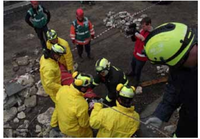
ALKALMAZZÁK A FELSZERELÉSEKET – ÉLETMENTÉS ALPINTECHNIKÁVAL

ahol eltűnt egy asszony, akit már 5 napja kerestek, eredménytelenül. A Somogy Mentőcsoporthoz tagjai az elsajátított INSARAG irányelvek felhasználásával, a kutatási feladat szakszerű végrehajtásával, valamint légi felderítés segítségével a helyszínre érkezés után 1 órán belül megtalálták az eltűnt, idősebb hölgyet, aki még életben volt.