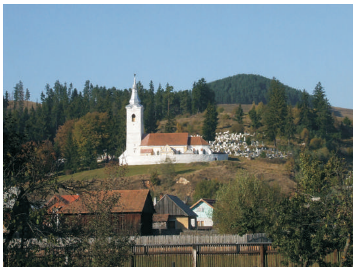
Figura 1. Lăzarea. Biserica romano-catolică. Amplasarea sitului de epoca bronzului

Debutul în anul 2007 a lucrărilor de restaurare la biserica romano-catolică de la Lăzarea a impus și efectuarea unor săpături arheologice preventive. Ele au fost conduse de Lóránt Darvas de la Muzeul Secuiesc al Ciucului. Biserica este amplasată în partea de sud-est a dealului Szármány, ce se desprinde spre vest din munții Giurgeului, pe malul drept al pârăului Csinód. 27 Poziția sa oferă o bună vizibilitate asupra zonei și o protecție naturală împotriva curenților de aer, a posibilelor inundații sau a ceții groase din anotimpurile mai reci (fig. 1).