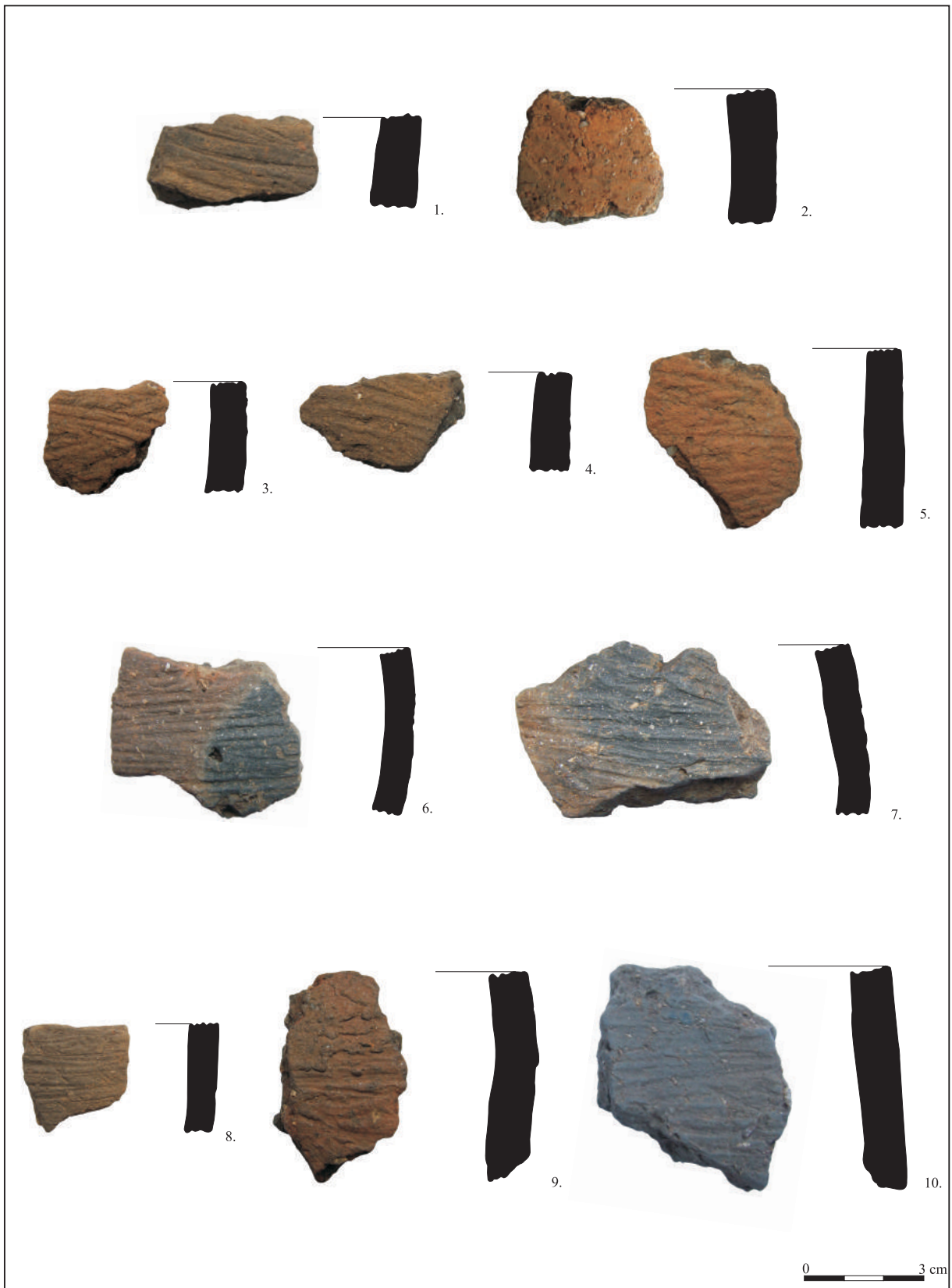
Planșa III. Lăzarea. Biserica romano-catolică. Fragmente ceramice aparținând epocii bronzului