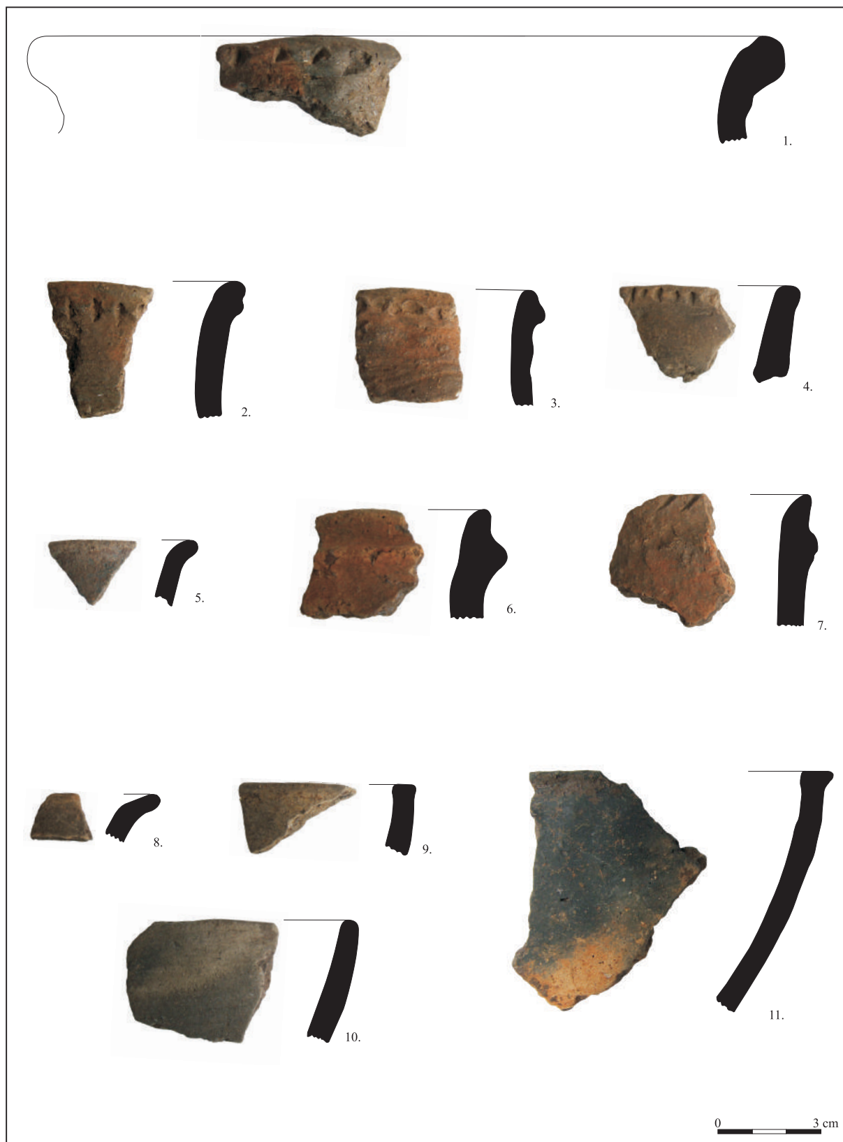
Planșa I. Lăzarea. Biserica romano-catolică. Fragmente ceramice aparținând epocii bronzului