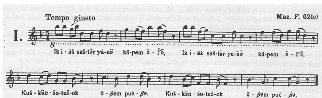
1. példa Bartók Béla „A magyar népdal” könyve Appendixének első példája: egy felső kvartváltó cseremiszdal

Az egyik réteget a magyar népzeneire jellemző ereszkedő négyesoros kvintváltó pentaton dallamok alkotják. Yrjö Wichmann finn néprajzkutató felesége 1906-ban hegyi cseremiszdalokat gyűjtött és küldött Bartók Bélának. A dallamoknak a magyar kvintváltó dallamokhoz való hasonlósága kétségtelen, noha második felük nem lefelé ugrik egy kvinttel, hanem felfelé egy kvarttal. 2 Bartók Béla be is emelte őket A magyar népdal című könyvének Appendixébe. 3 (1. példa)