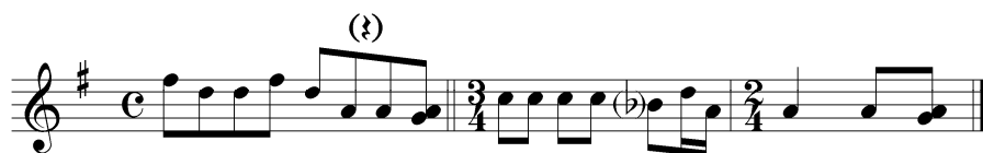
4. példa (Vargyas №208)

Vargyas №208 dallama alapjában véve két giusto sorból áll, melyekben 2/4-es, 4/4-es és 3/4-es ütemek váltakoznak. A dallam ti'-so-fa-(b)mi-re-do hangsora is ismeretlen a magyar sirató repertoárban. (4. példa)