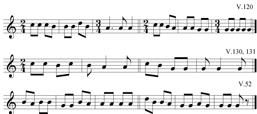
3. példa Finnugor siratók Vargyas (1953)-ból a) Vargyas №2 (=Väisänen №120), Vargyas №8 (=Väisänen №130), Vargyas №12 (=Väisänen. №52)

Még egyszer kiemelem, hogy a 3. példa dallamaihoz hasonló sorpáros, izometikus giusto dalok sok népnél megtalálható elemi formák. Ezek nem specifikusan finnugor illetve magyar zenei alakulatok, a magyar sirató stílus finnugor eredetét bizonyító erejük tehát csekély. A magyar siratóknak ugyanis a dúr-pentachordon egymás mellett haladó párhuzamos sorokon és az egymás melletti kadenciákon kívül meghatározó tulajdonsága a szabad kötetlen szerkezet és a rögtönzés is. Felmerül a kérdés: van-e finnugor népeknél szabad szerkesztésű és recitatív sirató forma?