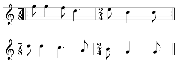
7. példa (Vargyas №212)

A №214 a szo-mi-(↑)do tritonon mozgó két rövid 5/8-os motívumból áll. Mindez szintén teljességgel idegen a magyar siratók tulajdonságaitól. 26 (8. példa)