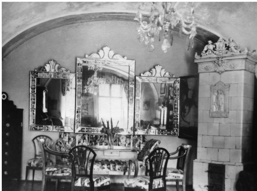
3. A nagyőri kastély egyik szobája velencei tükörrel. 1930. Fotográfia.

óhajtom, hogy az uraság jelenlétében nyitassanak a ládák, s a tükrök vigyázattal kezeltessenek.