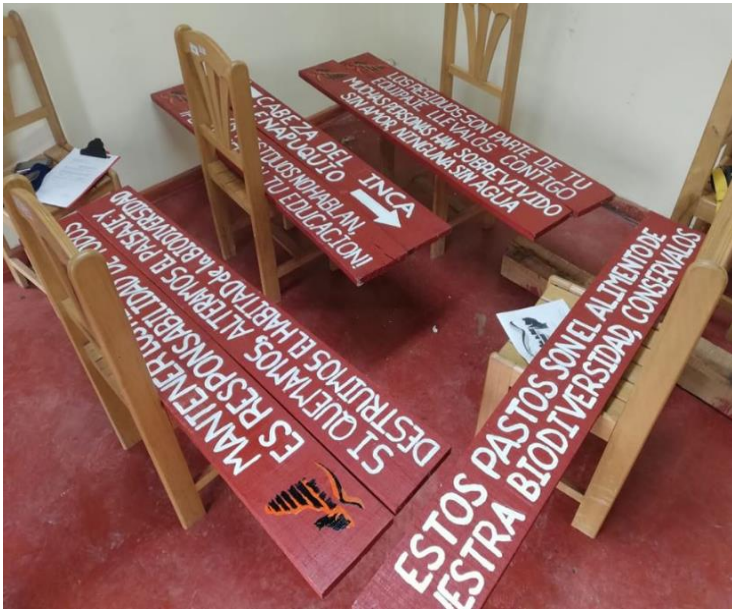
Figura 1: Señaléticas