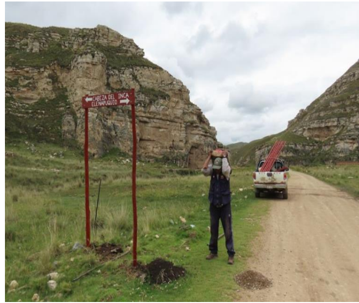
Figura 2: Rutas con poca señalización