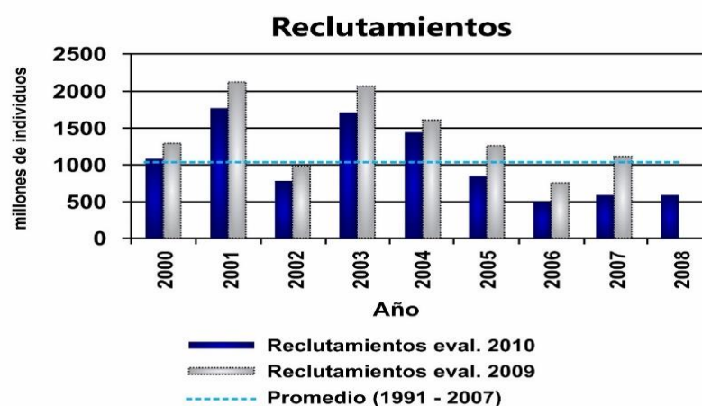
Figura 1: Reclutamiento del stock de anchoveta del norte de Chile y sur del Perú para 2000-2008 según las evaluaciones de 2010 y 2009 del IFOP y promedio del periodo 1991 – 2007 tomando en cuenta las estimaciones de la evaluación de 2010. Fuente: IFOP (citado por CeDePesca, 2010).

El desove y especialmente el reclutamiento son muy sensibles a los cambios en las condiciones ambientales (temperatura, salinidad, etc.), cuyos efectos se ven reflejados inmediatamente en el stock, dada la corta vida de la especie. Esta condición genera una alta variabilidad en el tiempo, que dificulta las proyecciones de biomasa (Subsecretaría de Pesca, 2008). Según CeDePesca (2010) en el período 2000-2008 el promedio de reclutas fue de mil millones, mucho más alto que en el período 1984-1990, cuando alcanzó en promedio 500 millones (Figuras 1 y 2).