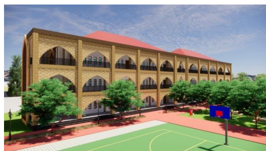
Gambar 2. Hasil Rancangan Eksterior Gedung Sekolah

Bentuk bangunan ruang luar pada SMAIT Kota Gorontalo didominasi dengan fasad yang dihiasi lengkungan-lengkungan dengan penggunaan warna yang tidak mencolok. Bahan yang menutupi lengkungan yaitu berasal dari keramik outdoor dengan motif batu alam timbul. Sedangkan pada permukaan kolom dan balok menggunakan relief bata ekspos dengan bahan GRC Relief, bahan ini menyelimuti seluruh struktur kolom dan balok yang terlihat.