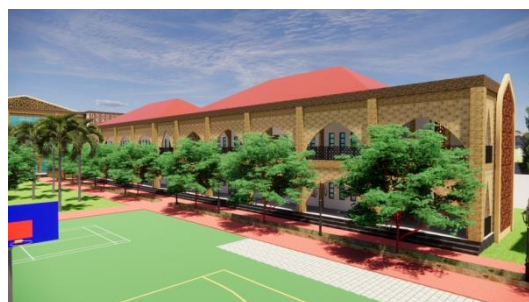
Gambar 3. Hasil Rancangan Eksterior Gedung Perpustakaan dan Laboratorium