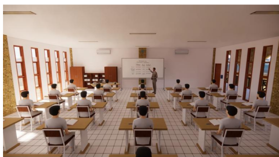
Gambar 5. Hasil Rancangan Interior Ruang Kelas

Bentuk bangunan ruang dalam SMAIT Kota Gorontalo didominasi dengan warna putih sebagai warna netral, juga didominasi bukaan jendela daripada dinding masif dengan tipe jendela double glass, sehingga ruang dalam mendapatkan sinar matahari yang cukup dengan meminimalisir hawa panas matahari yang akan masuk.