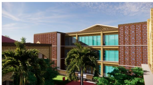
Gambar 4. Hasil Rancangan Eksterior Gedung Asrama