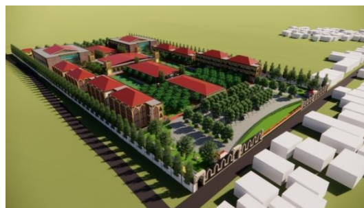
Gambar 1. Hasil Rancangan Tata Massa Bangunan SMAIT Kota Gorontalo

berbentuk barisan dengan bidang bangunan yang lebih besar menghadap ke arah timur dan barat.