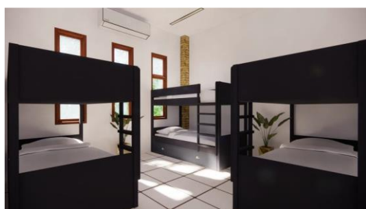
Gambar 6. Hasil Rancangan Interior Kamar Tidur Asrama