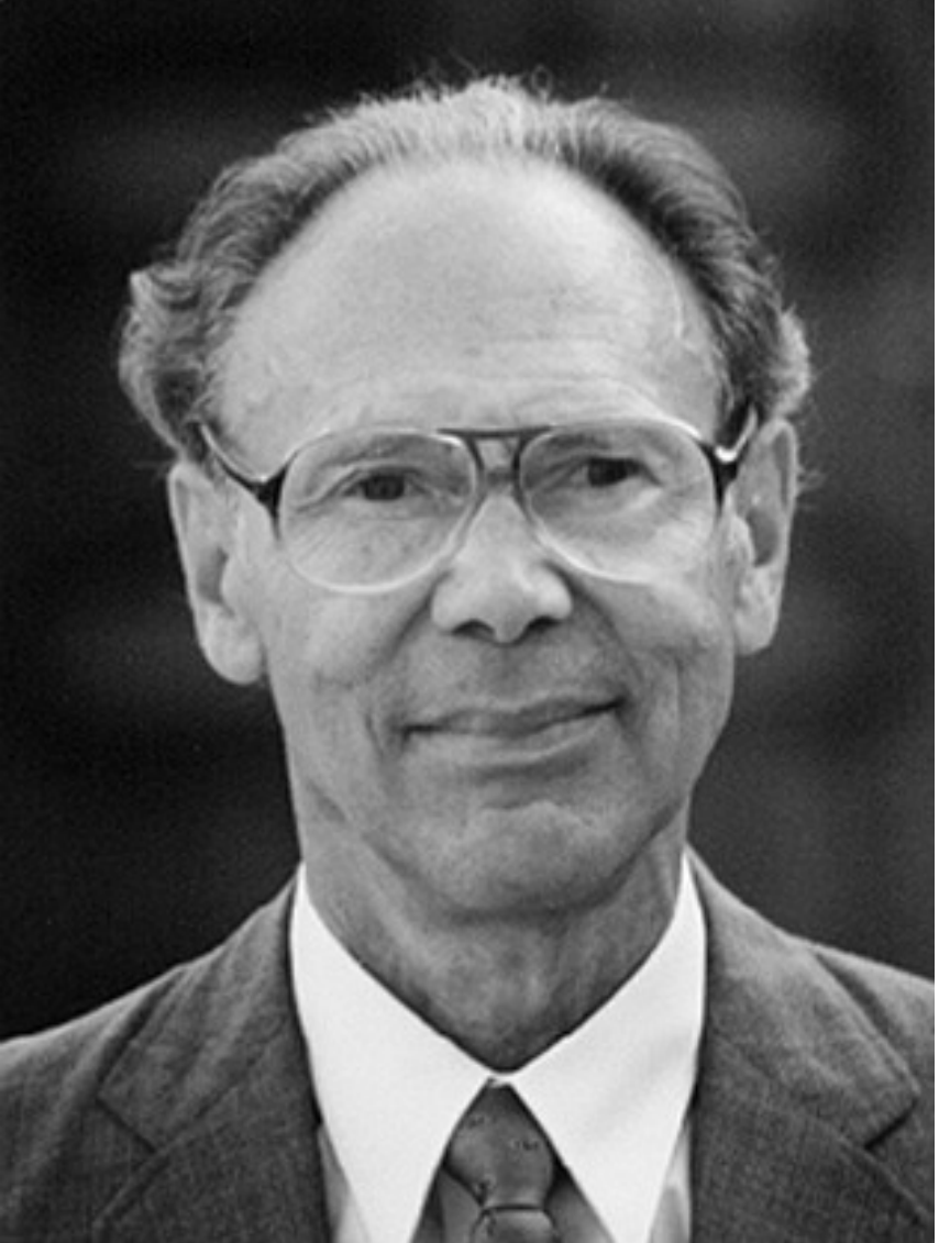
Kiss Elemér (1929–2006)