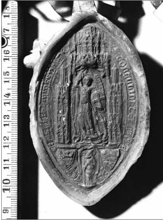
5. kép. Goblinus erdélyi püspök pecsétje, 1380; Bécs, HHStA, Familienurkunden 283/2.