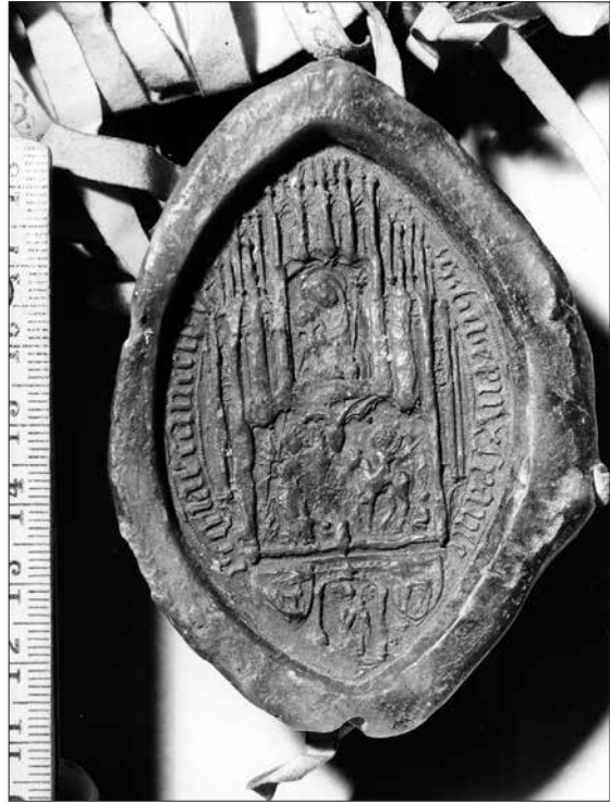
6. kép. Himházi Benedek veszprémi püspök pecsétje, 1380; Bécs, HHStA, Familienurkunden 283/2.

9. (12; 12) et Benedictus Vesprimiensis ecclesiarum [episcopus] - her Benedict bischof zu Vezzsprem [Himházi Benedek veszprémi püspök]