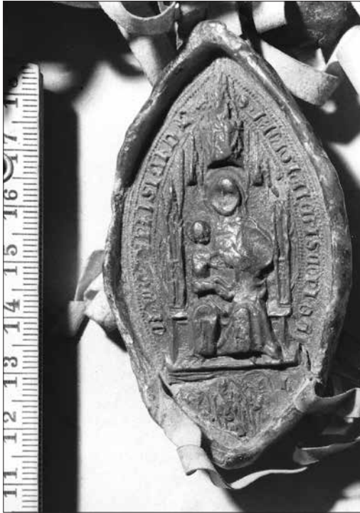
2. kép. Deméndi László váradi püspök pecsétje, 1380; Bécs, HHStA, Familienurkunden 283/1.