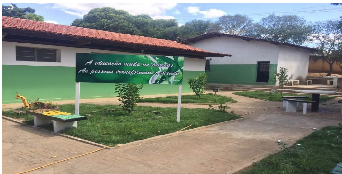
Figura 5. “A educação muda as pessoas”. “As pessoas transformam o mundo.” Salinas/MG.

Por fim, acredita-se que é de bom tom, finalizar este relato com a frase presente em uma das peças de comunicação que foram afixadas em um dos murais: “A educação muda as pessoas, as pessoas transformam o mundo”.