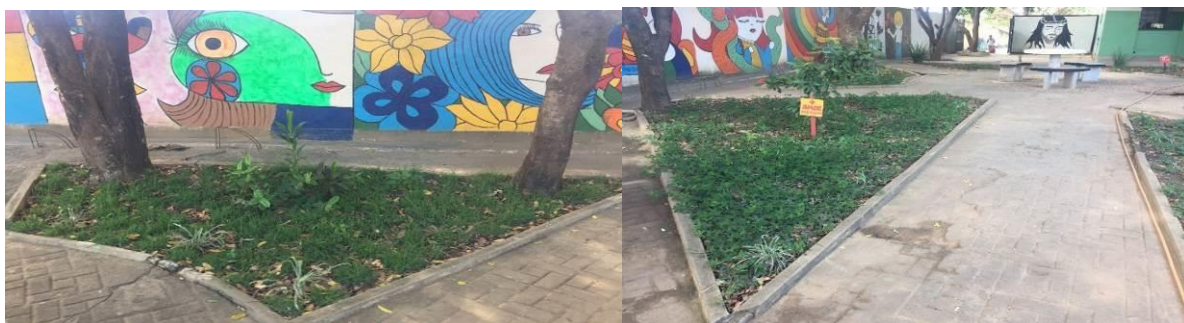
Figura 4. Resultado do projeto: mudança estética e de comportamento dos alunos, beleza artística e natural. Salinas/MG.

Ao contrário disso, para Bruno e Matos (2020) a ausência de educação provoca uma participação negativa na construção da cidadania socioambiental resultando no prejuízo dos resultados das políticas públicas que visam formar e informar cidadãos quanto a conscientização dos direitos socioambientais e defesa do meio ambiente.