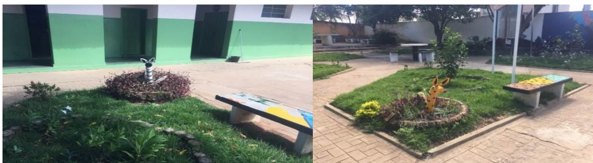
Figura 3. Treinamento, grama recortada em pequenos pedaços, plantio de mudas ornamentais e da horta. Salinas/MG.

Dessa forma, a organização das atividades, estabelecidas as etapas, ocorreram da seguinte maneira: 1ª Etapa: prospecção do local onde o projeto foi realizado; 2ª Etapa: Diagnóstico do local; 3ª Etapa: Elaboração de projeto gráfico e definição da demanda de recursos para implementação como as mudas e os insumos diversos, como a seleção das mudas e dos tipos ideais de fertilizantes; 4ª Etapa: análise e parecer técnico e de viabilidade dos profissionais do IFNMG; 5ª Etapa: treinamento in loco , realizado pelos alunos do curso de engenharia florestal antes do início da execução do projeto (Figura 3); 6ª Etapa: execução do projeto, através do plantio de gramineas (que foram plantadas de forma espaçada, devido à restrição de recursos do projeto) e de mudas ornamentais nos canteiros, da horta orgânica, do plantio e proteção das mudas arbóreas com estacas e identificação destas com placas (Figura 2 e Figura 3); 7ª Etapa: limpeza da área externa, separação e recuperação dos materiais que foram reutilizados (pneus, pedras), construção de canteiros para jardinagem, criação de esculturas com materiais recicláveis e de peças de comunicação, que foram fixadas nas dependências dos jardins da escola, visando conscientizar a comunidade acadêmica sobre a importância da manutenção dos jardins.