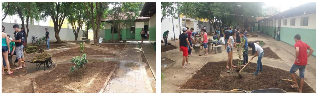
Figura 2. Áreas sem cobertura vegetal. Salinas/MG.

Nas visitas iniciais e reuniões com a direção da escola, constatou-se que, dados os limites de recursos e de pessoal, os espaços a serem reestruturados e que gerariam o maior impacto na estética, lazer e bem-estar da comunidade escolar, seriam as áreas 1, 2, 3 e 4 do lado B da Figura 1. Dessa forma, uma vez realizada a planta-baixa da escola, foi elaborada um diagrama visual, que facilitará o planejamento do projeto paisagístico.